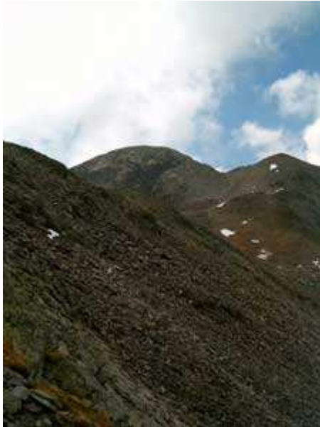
Nuestro objetivo más cerca