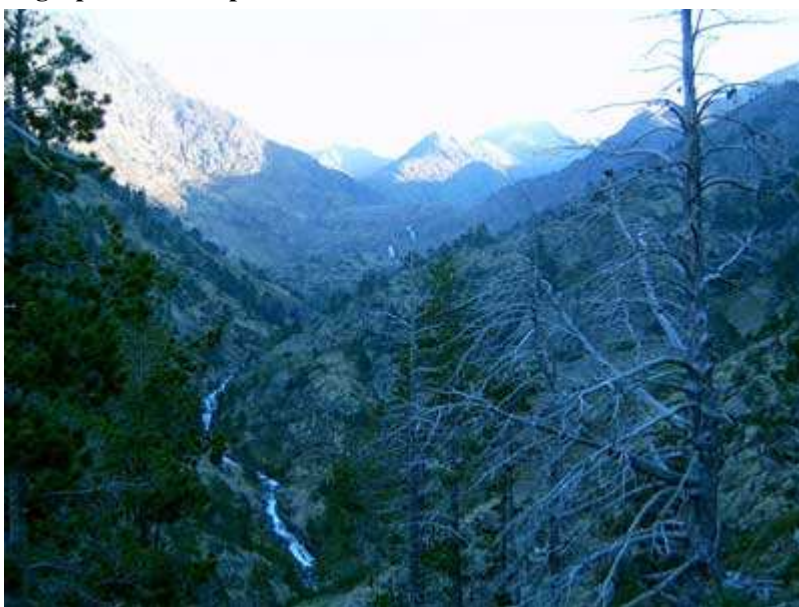
Barranc de Sotillo. Nuestro objetivo aún no se ve

comarcal que sale de la población de Llavorsí.