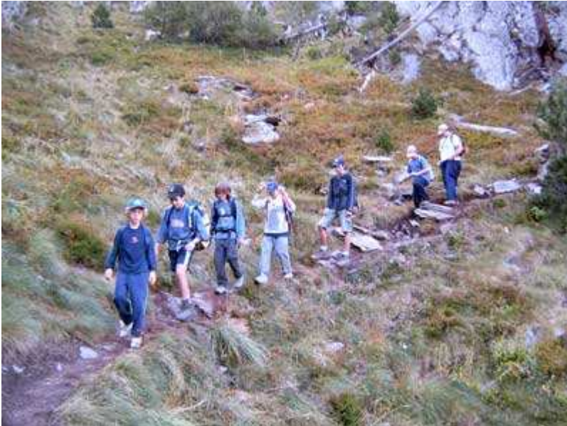
Por el Barranc de Sotllo

El día 30 al amanecer, iniciamos la marcha con la comida y la ropa de abrigo necesaria para pasar el día. Son las 7h.