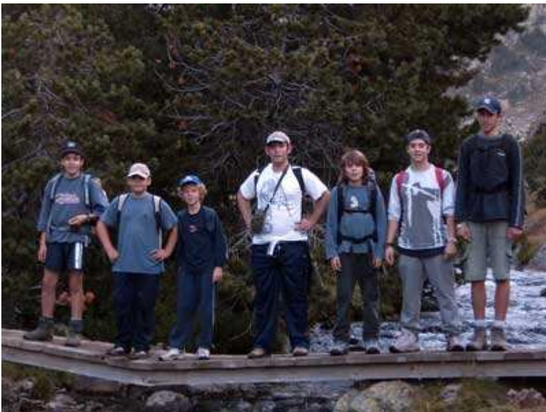
Paso del torrente

Rápidamente llegamos al refugio de Vallferrera , donde aprovechamos para comer algo.