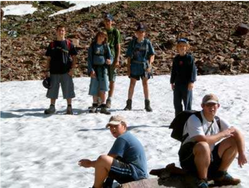
En un nevero

En esta foto se aprecia el Port de Sotllo, enorme pedregal que no tiene fin.