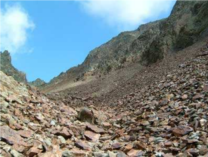
Continúa el Port de Sotillo

Aún no se ve el final del Port de Sotillo.