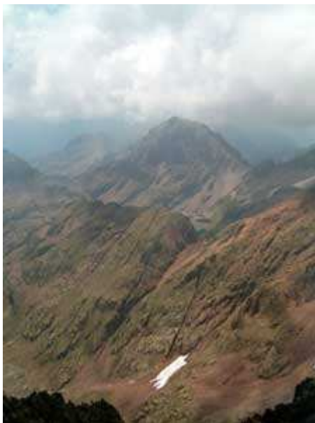
Vistas desde la Pica.

Se consiguió !!! Eran las 14:30 y se había conseguido superar la Pica d'Estats con sus 3.145 m de altitud, es el techo de Catalunya.