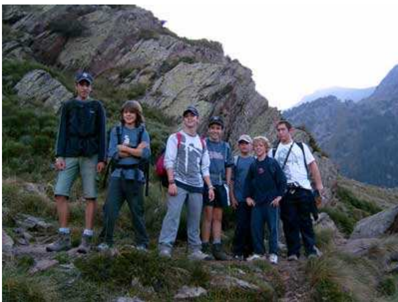
El grupo una vez superadas Les Pales de Areste.

Excursión de 2 días con un recorrido de 19,69 km y 1.877 m de desnivel acumulado. La pendiente máxima, en un tramo superior a 50 m, es de 79,20%. Para su planificación he utilizado el mapa de la Editorial Alpina, "Pica d'Estats. Mont-Roig" a E. 1:25.000, realizado con el Datum Europeo 1950