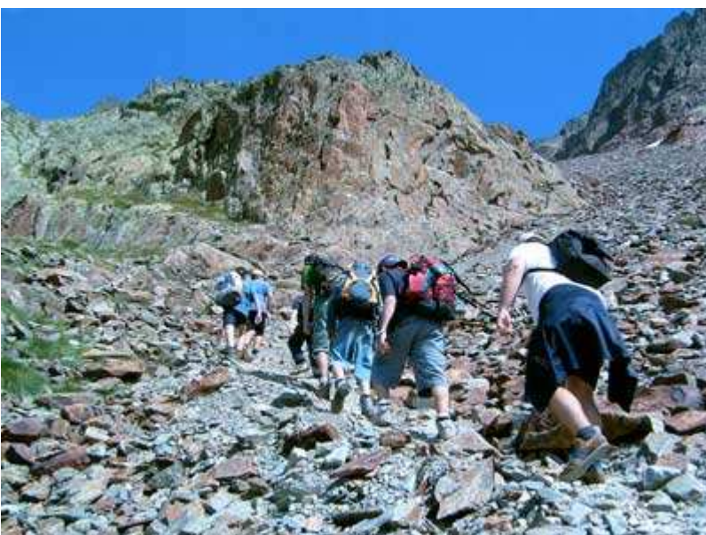
Ascenso al Port de Sotllo

Descanso en un nevero, donde los chavales se entretienen con la nieve, en esta época del año. El esfuerzo que se está realizando empieza a tener sus efectos en algunos miembros del grupo.