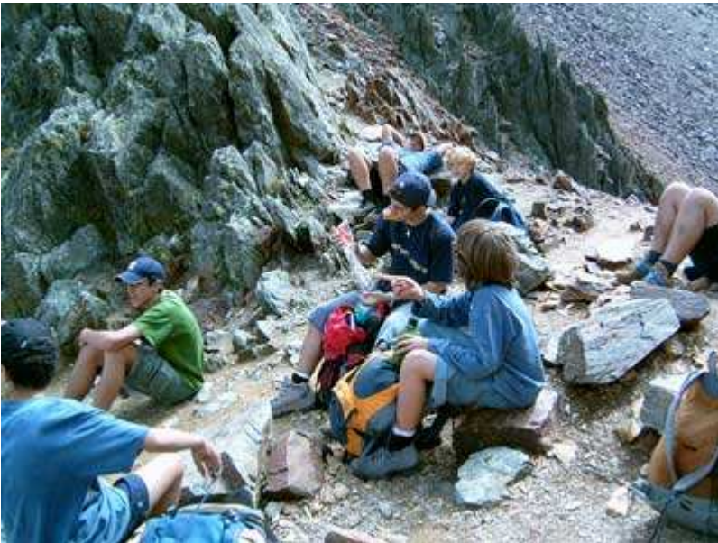
Descanso en el Port de Sotillo

A esta altura el dominio de la roca es total. No existe nada más.