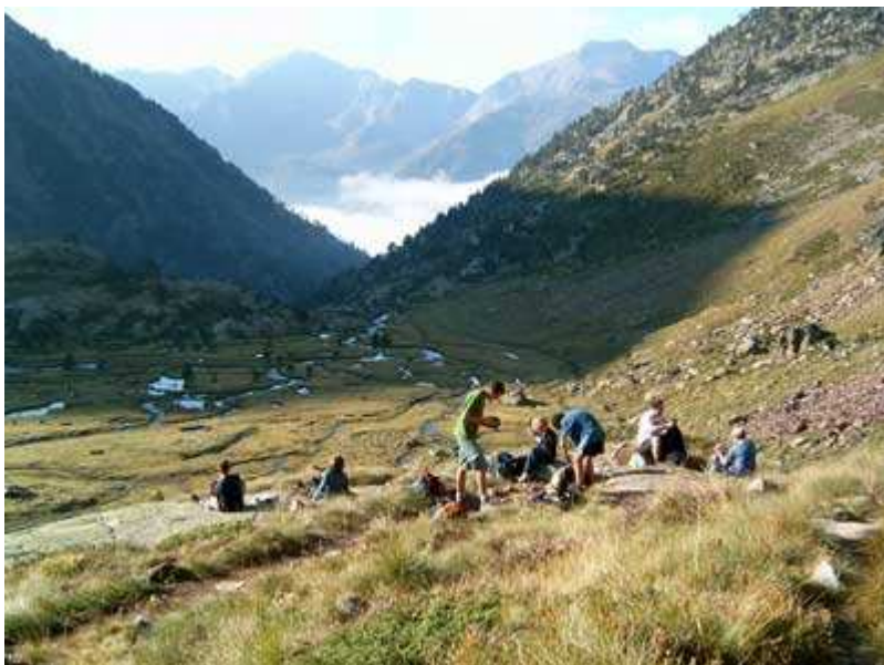
Plans de Sotllo

Cuando llegamos a la zona conocida como Plans de Sotllo, aprovechamos para quitarnos ropa de abrigo, pues el Sol ya hace acto de presencia y reponemos fuerzas.