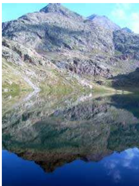
Estany de Sotllo

Cuando llegamos a la zona conocida como Plans de Sotllo, aprovechamos para quitarnos ropa de abrigo, pues el Sol ya hace acto de presencia y reponemos fuerzas.