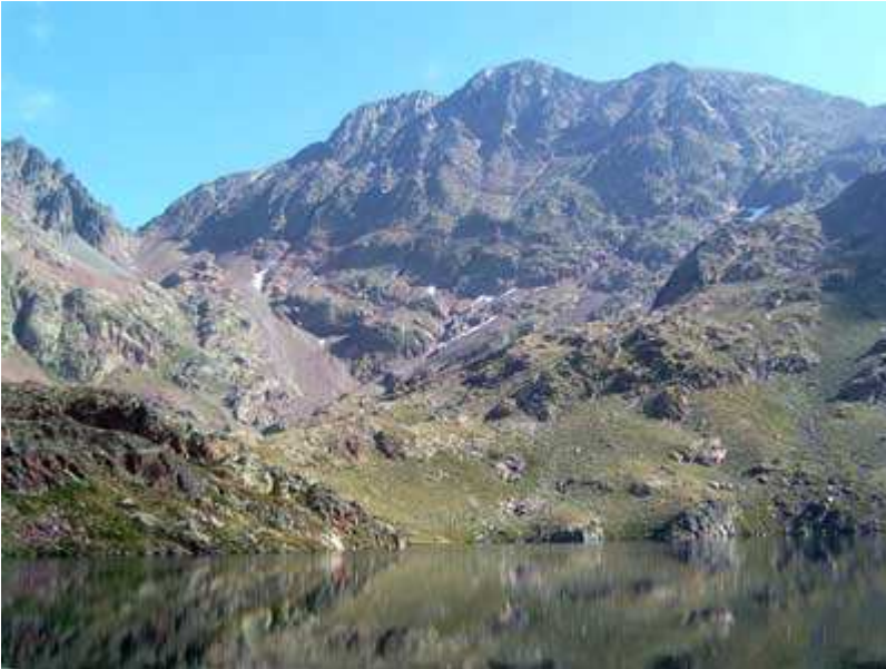
La Pica d'Estats. Estany d'Estats

La Pica d'Estats reflejada en el Estany d'Estats.