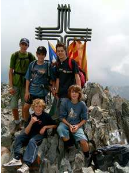
En la Pica d'Estats