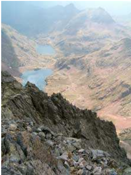
Vistas desde la Pica.