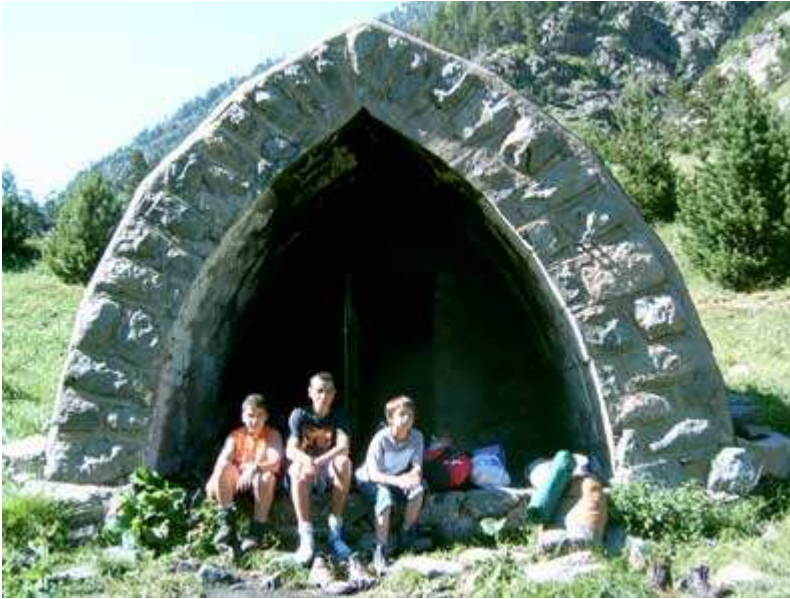
Cabaña – refugio del Quillón.