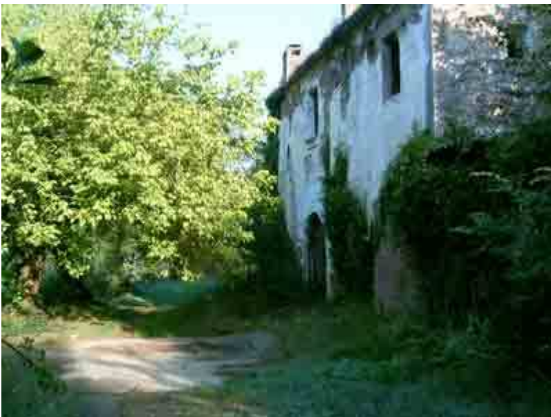
Ruinas de Can Campreciós

la pista, conocida por los bikers, como “de la Siberia”, por el frío que hace especialmente en invierno, es una pista hombría por la que cuando se sube o baja, se nota el cambio de temperatura. En invierno la puedes ver totalmente blanca, de la helada, sin haber nevado.