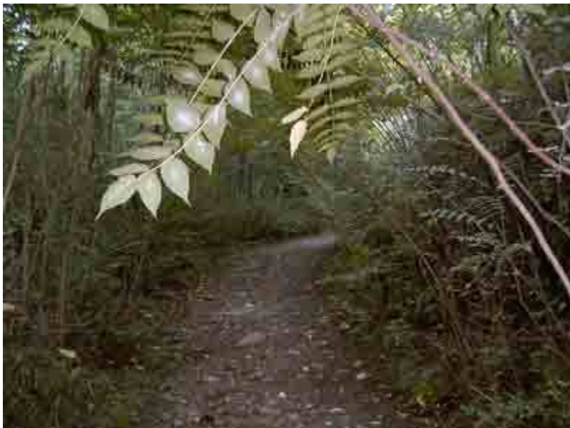
“La Siberia” antes de llegar a la zona de descanso