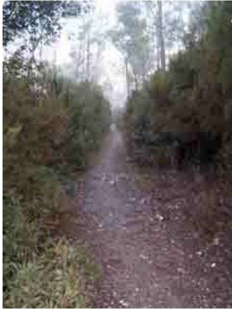
Pista por el torrente de les Bobines