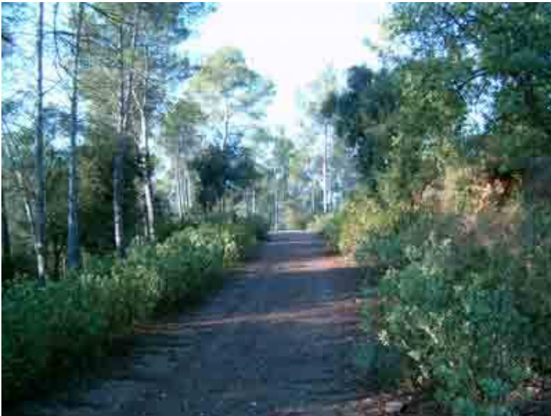
Pista por el Turó del Tano