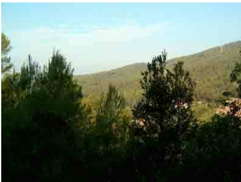
Vista de la Serra de Can Julià y casas de Can Castellví

Seguimos por el camino que sube por la vertiente sur de la Serra de Can Julià, y que nos dejará en las proximidades de Ca n'Amigonet, zona conocida ya por todos.