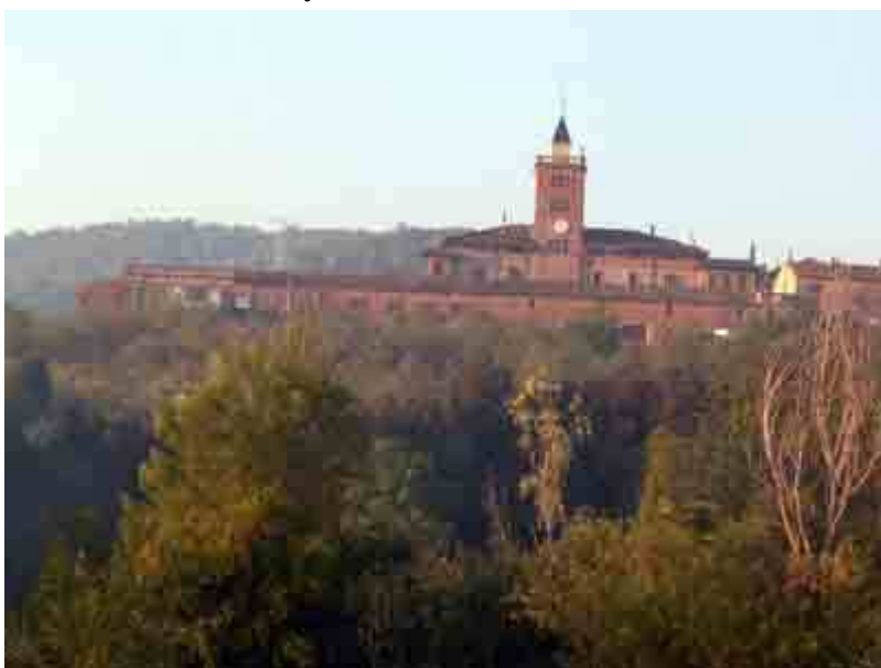
Vista general de Can Montmany