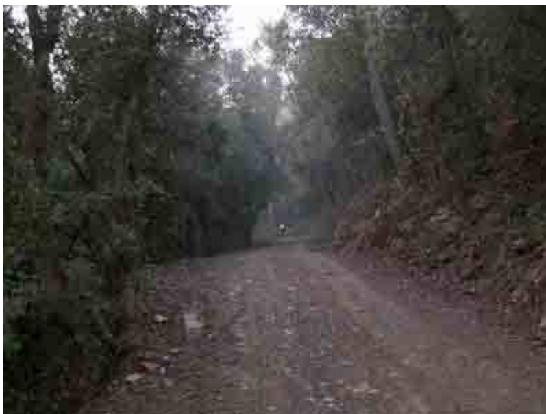
Pistas por la Serra de Can Rabassa

Hoy hemos realizado una ruta que podríamos considerar atípica, pues la mayor parte del recorrido lo hemos realizado por senderos que no entran dentro de las rutas típicas de BTT, aunque de existir los caminos y senderos, es muestra de que son transitados y tienen su encanto.