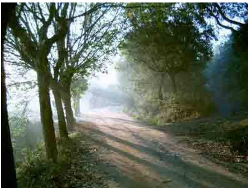
Acceso a Can Montmany