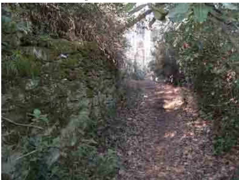
Sendero por la Penyes d'en Castellví