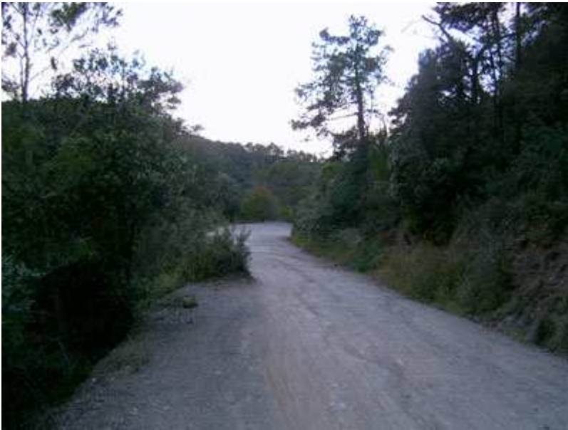
Pistas por la Serra de Ventosa