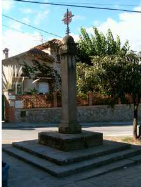
Crucero en Valldoreix