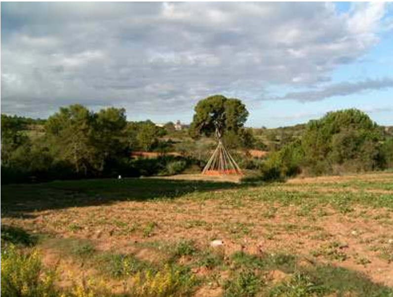
El Pi d'en Xandri