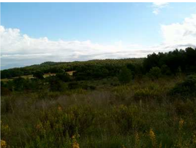
Zona de monte bajo

Una vez superada la Rambla de Can Bell y cruzada la carretera, se inicia la zona más dura de orientación y el tramo más urbano, pues hasta ahora las pocas calles de urbanización por las que he pasado estaban sin asfaltar. A partir de la Colonia Badia se inicia el asfalto (aunque tranquilo tienen carril bici, solo un tramo). Piensa que es obligado este tramo o uno similar pues se ha de buscar el paso subterráneo de la vía del tren y el paso elevado de la C-16 (Túneles de Vallvidrera), de lo contrario nos pueden obligar a dar un largo rodeo.