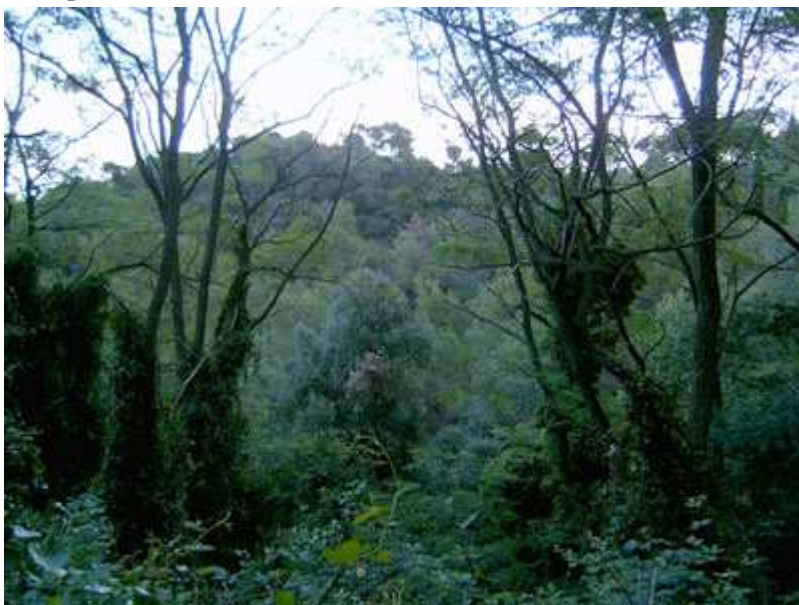
Pista por la Serra de Ventosa