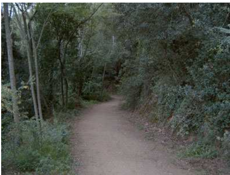
Pista por la Serra de Ventosa

El Papiol - Les Escletxes - Coll d'en Faura - Collet de Batllivell - Coll del Diari - Coll Blau - Coll del Penitent - Coll del Gravat - Coll de l'Elerola - Portell de Valldaura - Turó d'en Fotjà - Serra de Ventosa - Can Catà - Can Coll - Can Codonyers - Torre Cendrera - Rambla de Can Bell - La Colònia Badia - Valldoreix - Torrente de les Bobines - Serra de Roques Blanques - Serra del Misser - El Papiol