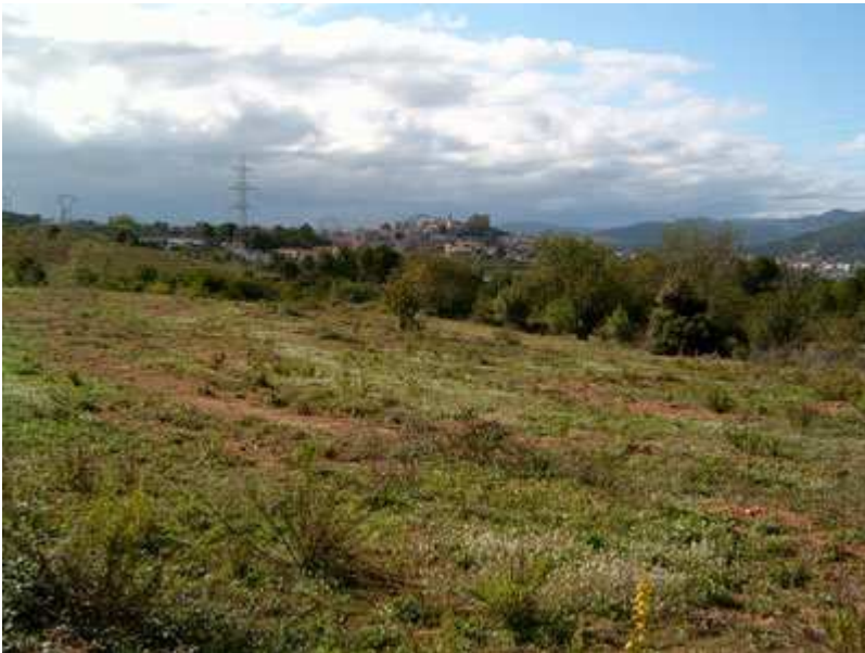
Vista del Papiol

Una vez que se entra en el torrente de Les Bobines, vuelven los senderos y el bosque típico de Collserola. Estos senderos me llevarán hasta alcanzar el PR C-35, que cruza la Serra de Roques Blanques y la Serra del Misser , terminando prácticamente en la estación de ferrocarril del Papiol.