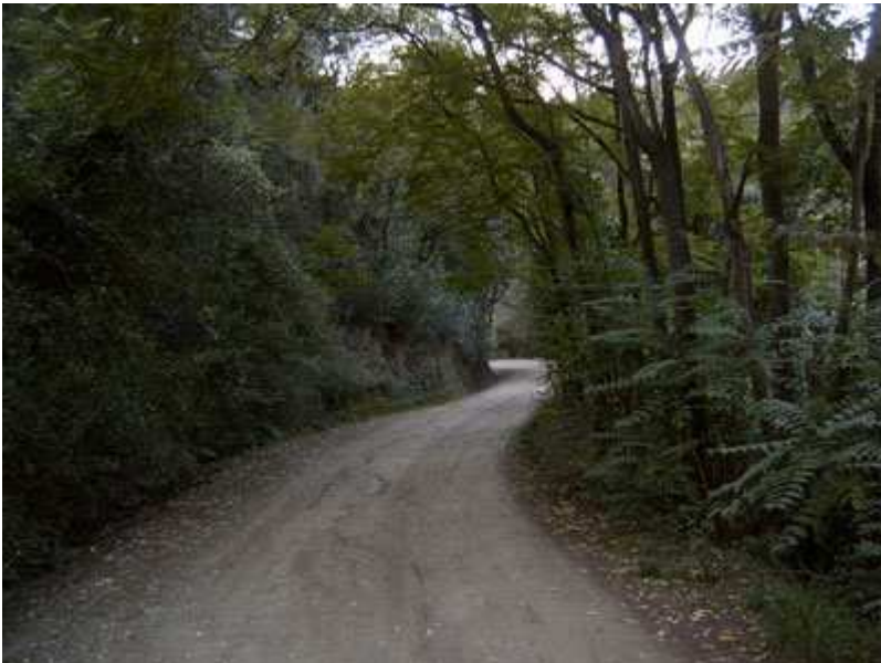
Pistas en dirección a Can Catà