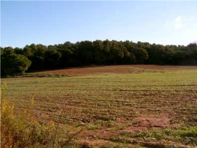
El Bosque visto desde Sant Cugat