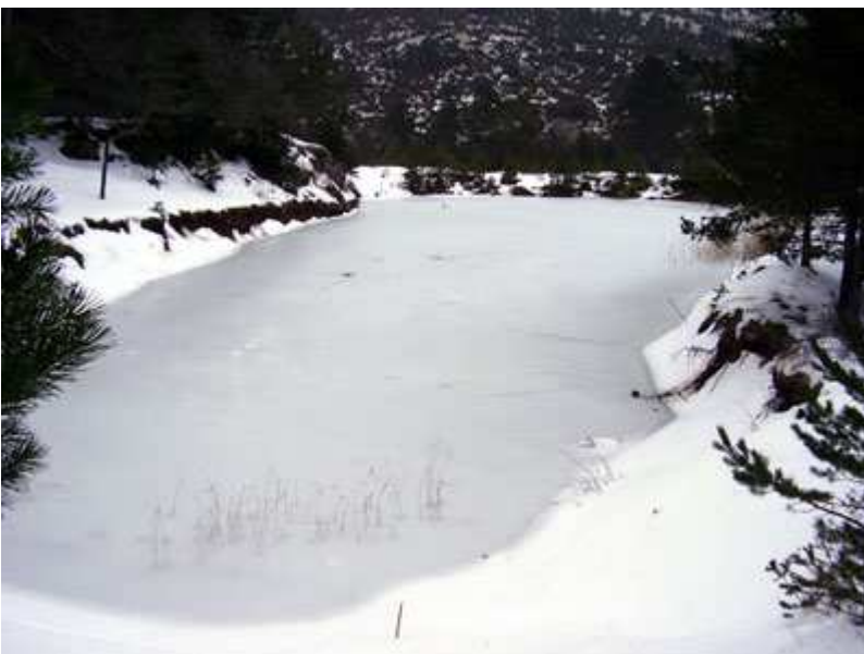
Balsa de agua helada.