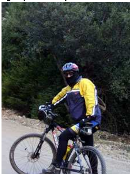
Albert. Se empieza a notar el frío

situado en la confluencia de las comunidades de Catalunya, Aragón y Valenciana. Los Puertos son un macizo montañoso situado en la parte oriental del sistema Ibérico que enlaza con la cordillera Prelitoral Catalana. Es un sistema de tipo calcáreo (roca caliza).