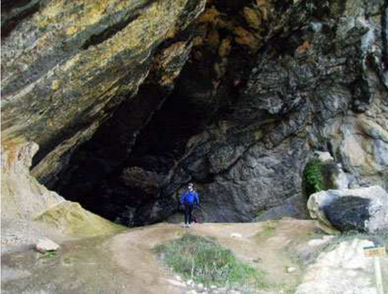
La cova de vidre.