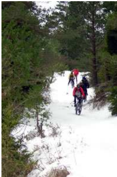
El grupo inicia el descenso