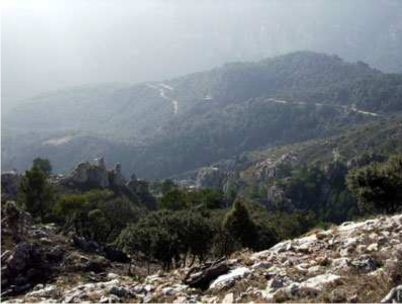
Vista general de la pista que hemos subido