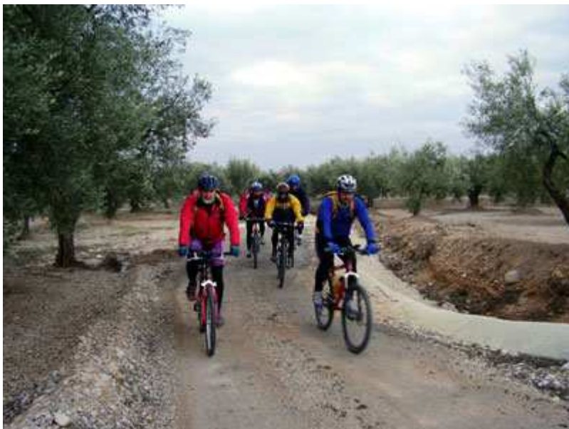
El grupo por las Planas, entre las oliveras

Ruta muy bonita, que se hizo excesivamente dura al tener que caminar sobre la nieve, empujando nuestras bicis, durante 3,5 h y con temperaturas de 0°C. Esto es deporte de aventura...!!!