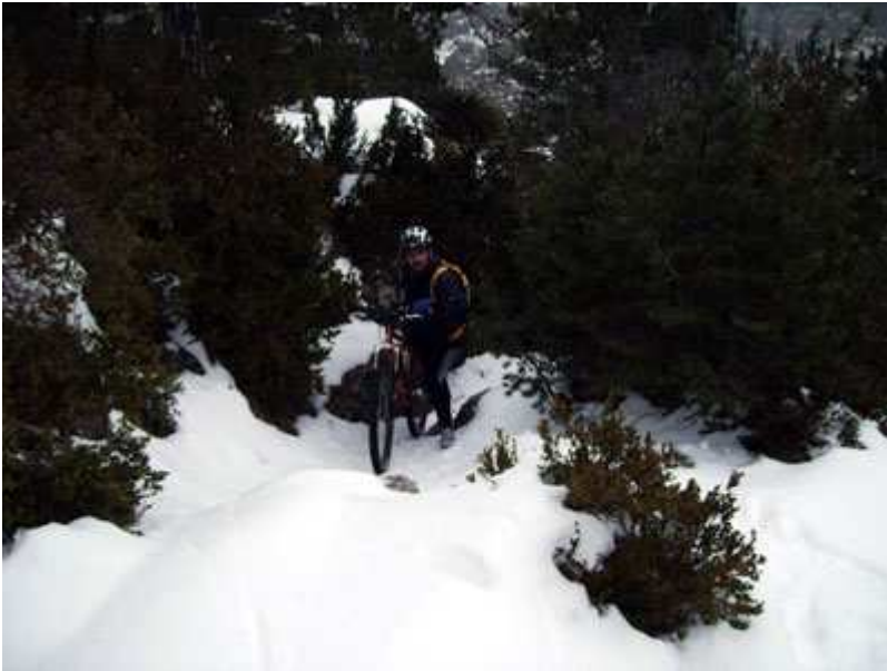
Paco subiendo a la Portella.