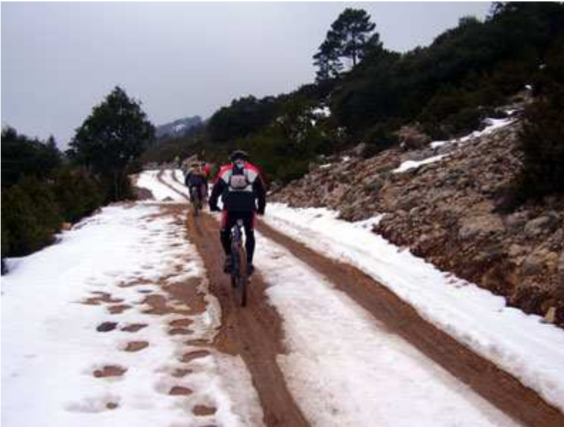
Aparece la nieve.