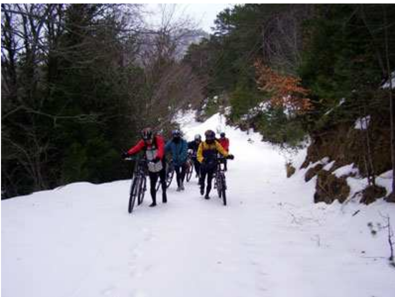
Seguimos el descenso en un falso llano