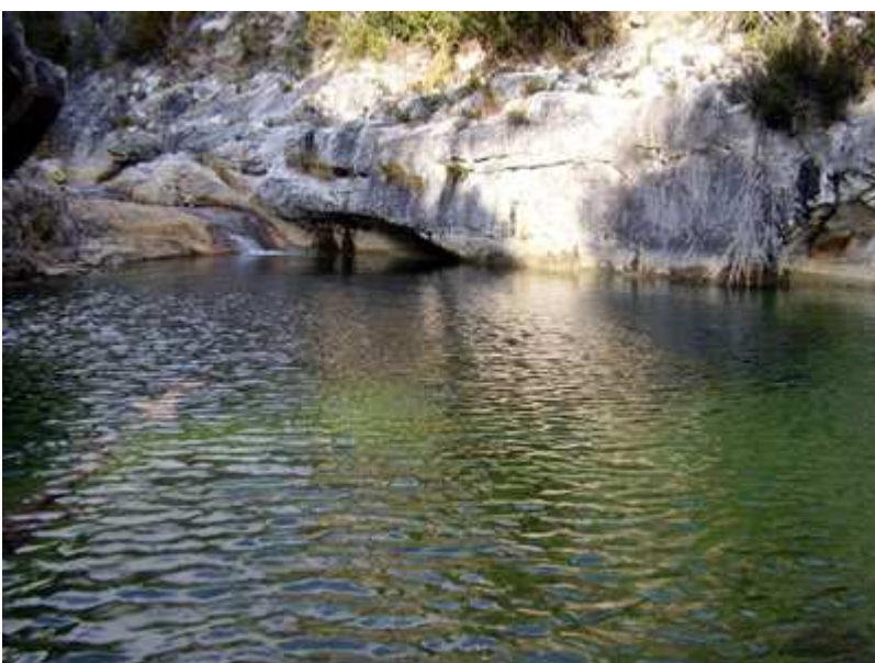
Un rincón de aguas cristalinas