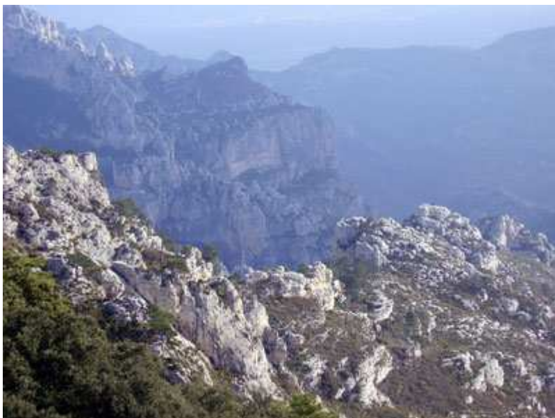
Vista general del Parque