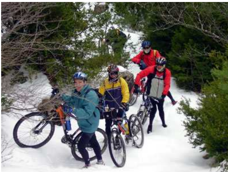
Continúa la subida a la Portella