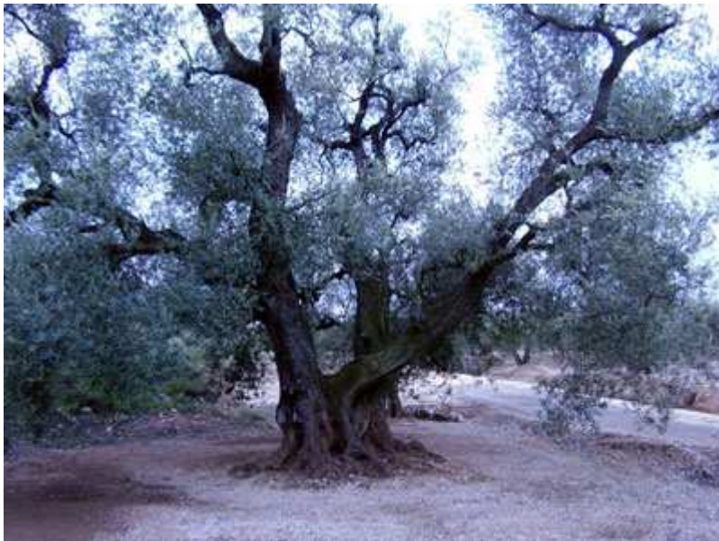
Una olivera entre tantas.