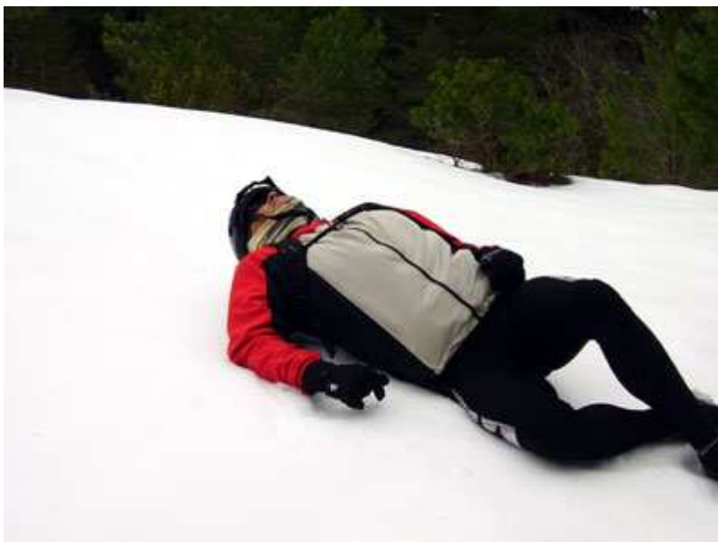
La broma de Ramón, reflejo del agotamiento del grupo