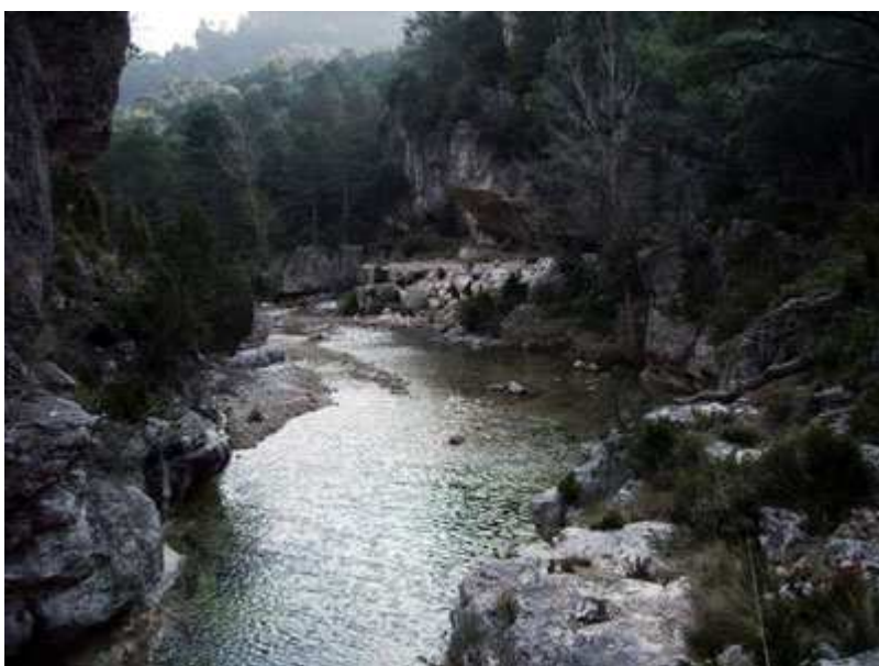
Barranc del Retaule