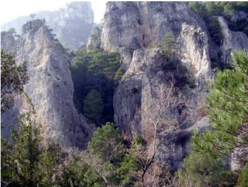
Barranc de la Fou