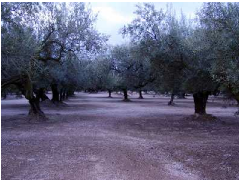
La Plana Bonica

La Sénia - Planes Noves - Plana Bonica - Barranc de la Galera - Masets de Silvestre - Xalet Forestal - Cova del vidre - Font de la Llagosta - Casetes Velles - Portella de Calça - Mas de Pataques (ruinas) - Barranc del Retaule - Racó de l'Avellanar - Barranc de la Fou - El Magraner - Pantà d'Ulldecona - CV-105 - La Sénia.