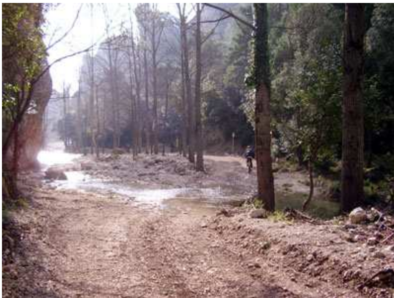
Barranc del Retaule