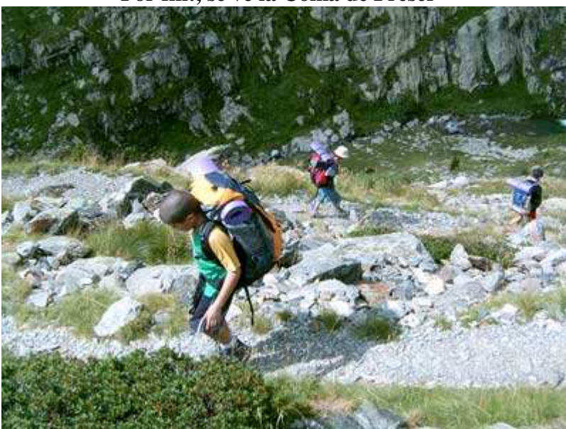
Descenso hacia el refugio de Coma de la Vaca http://www.bttysenderismo.com

Nos encontramos a 1600 m de altitud, y la vegetación comienza a disminuir, para ir dando paso, poco a poco a la montaña pelada.