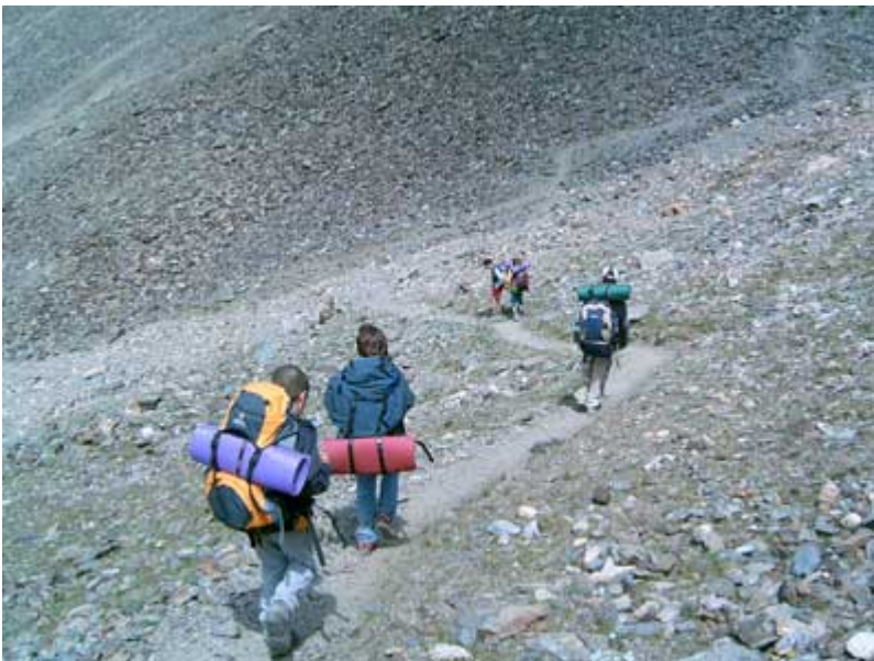
Seguimos descendiendo del Coll de Nou Creus

En el descenso del Coll de Nou Creus, el viento y el frío es la nota predominante. Los chicos se han animado, pues ya ven Nuria desde el Coll, y todo es bajada (no saben lo duro que es bajar).