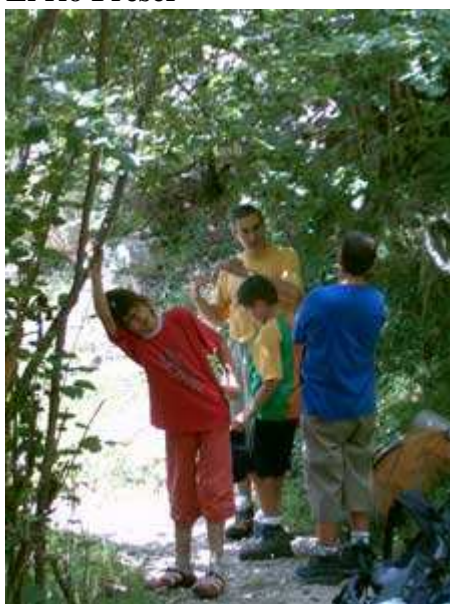
Un descanso en la sombra

El río Freser cada vez queda más abajo, encajonado entre las paredes de las montañas y nosotros seguimos subiendo.