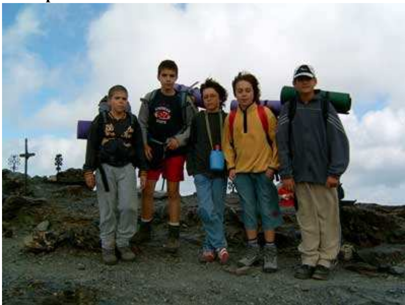
Pic Superior de la Vaca. Frotera con Francia

Una vez en el Coll del Nou Creus (2794 m de altitud), el viento y el frío, hace que hagamos las fotos de rigor, e iniciemos seguidamente el descenso.