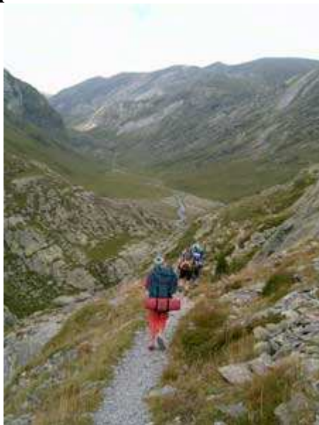
Por fin!, se ve la Coma de Freser