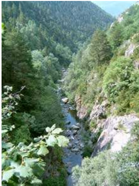
El río Freser

Cuando ya llevamos aproximadamente 2,5 km de recorrido, llegamos a una fantástica cascada, llamada del Grill, en la cual hicimos una parada y tomamos unas fotografías.