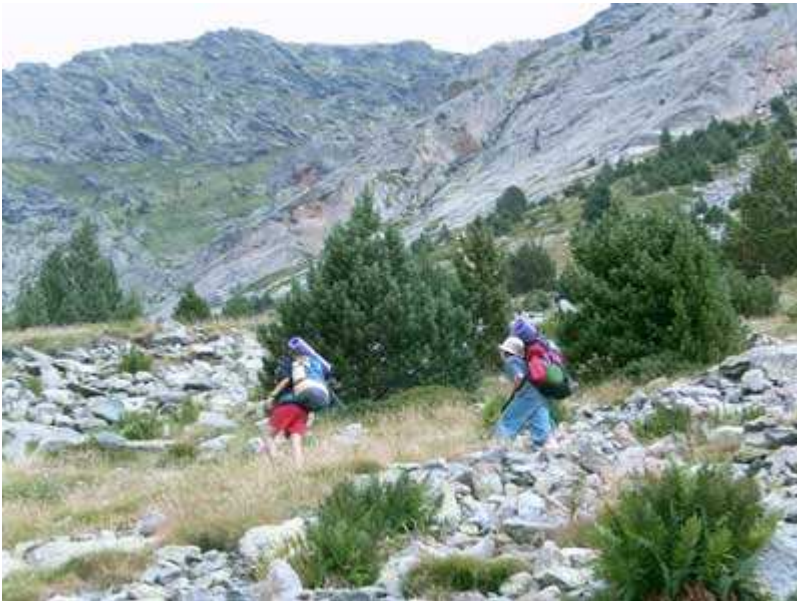
Aumenta la pendiente del camino