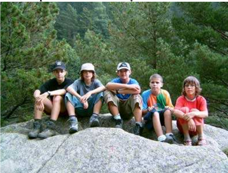
Un alto en el camino