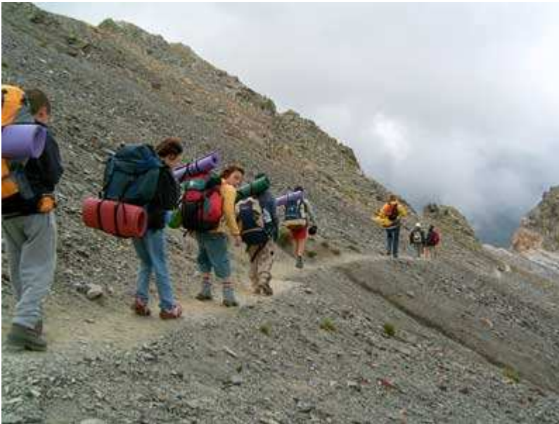
Descenso del Coll de Nou Creus

En el descenso del Coll de Nou Creus, el viento y el frío es la nota predominante. Los chicos se han animado, pues ya ven Nuria desde el Coll, y todo es bajada (no saben lo duro que es bajar).