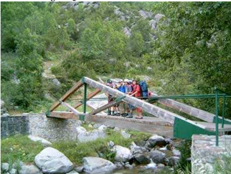
Puente de Daió

Después de muchas semanas sin lluvias, siendo uno de los meses más secos desde hace mucho tiempo, se anuncia en el Pirineo, un tiempo algo inestable, con chubascos, especialmente a las tardes. Motivo por el cual, junto con el echo de que no se como responderán los chavales, decido llevar una tienda de campaña de 5 plazas, pues la idea era hacer vivac, al aire libre.