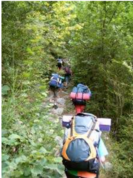
Subiendo por senderos estrechos y frondosos