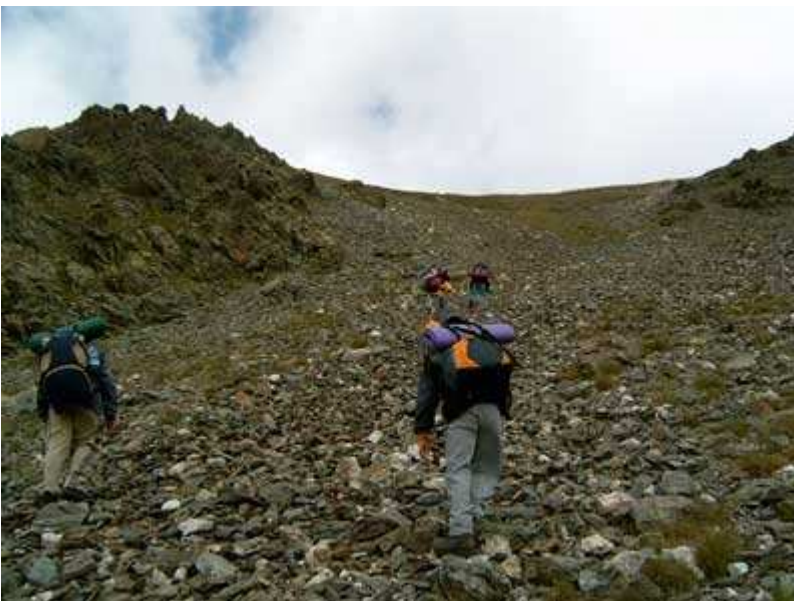
Coll de Carançà