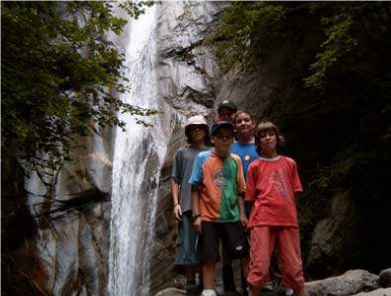
En salto del Grill

Cuando ya llevamos aproximadamente 2,5 km de recorrido, llegamos a una fantástica cascada, llamada del Grill, en la cual hicimos una parada y tomamos unas fotografías.