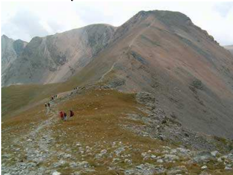
Coma de la Vaca y Serra del Torreneules

En el Coll de Carança nos encontramos con un grupo de montañeros que descienden por la cresta del Pic Superior de la Vaca. Frontera con Francia.