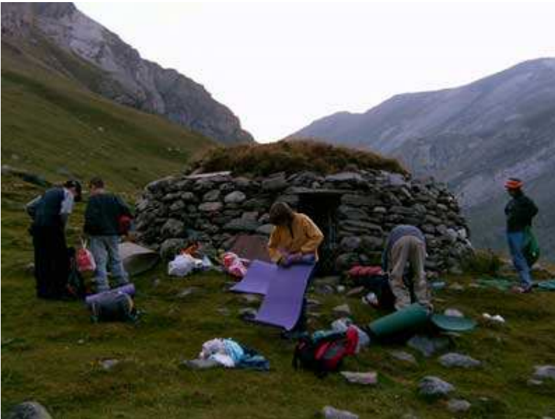
Barraca de Coma de la Vaca