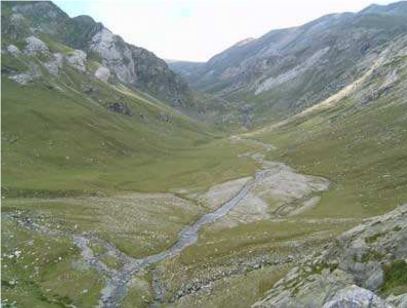
Coma de Freser