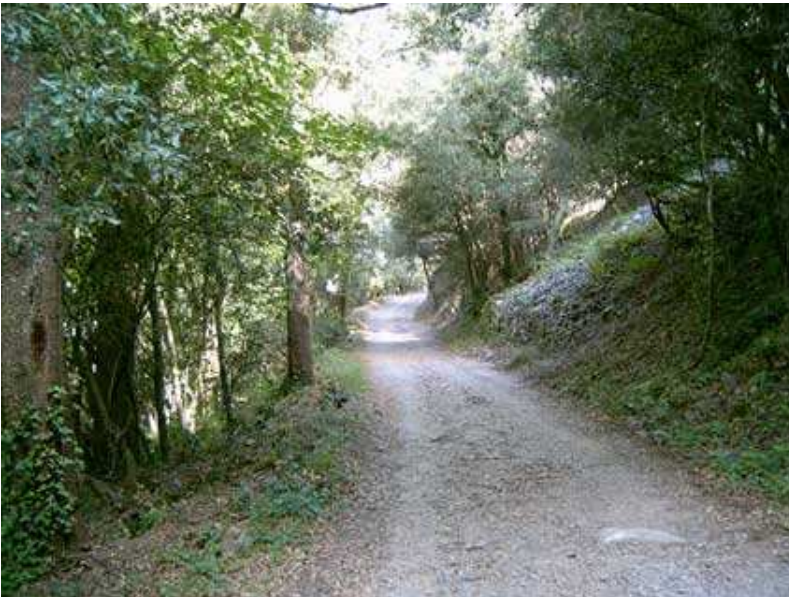
Pistas protegidas del sol