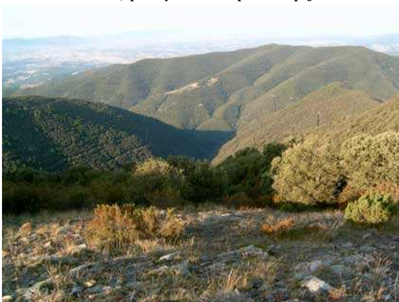
Vista desde el Coll del Pou d'en Besa

en alguna de ellas un hilito muy fino, pero que con un poco de paciencia se llenaba la botella. Os ayudará a dosificar el agua durante la excursión.