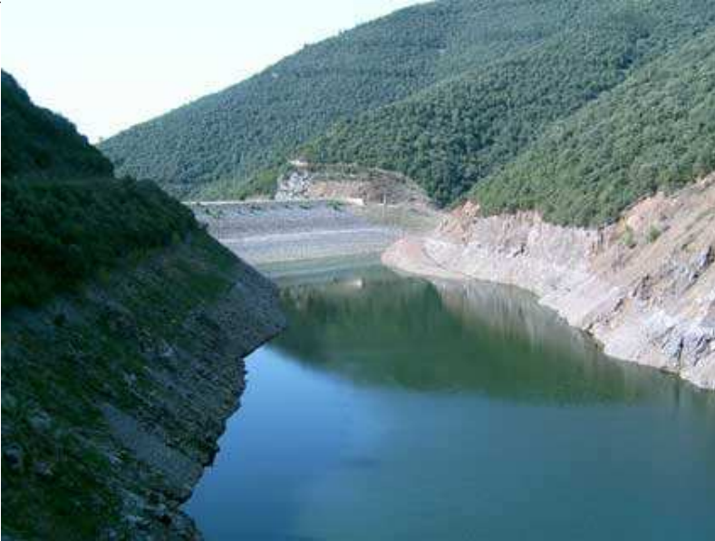
Pantano de Vallornès