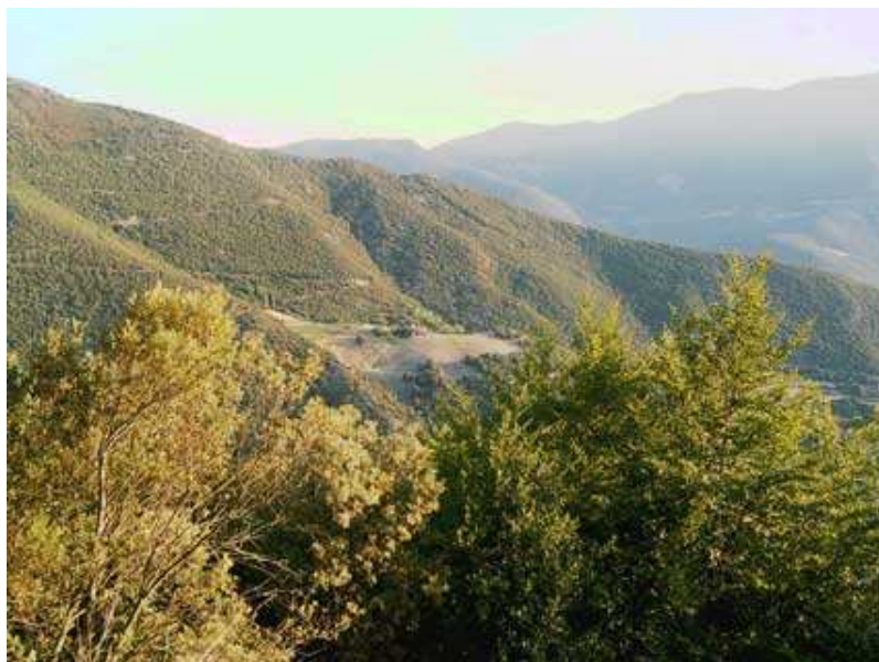
Vista del Molar de Dalt

Montseny pueblo (parking de las piscinas) - El Samon - Coll del pou d'en Besa - Castanyer d'en Cuc - Baga d'en Cuc - Riera de Vallfornès - Pantà de Vallfornès - Vallfornès - Pla dels Trèmols - Pla de la Calma (GR5) - Collformic - Albergue de El Vilar - El Molí - Parking