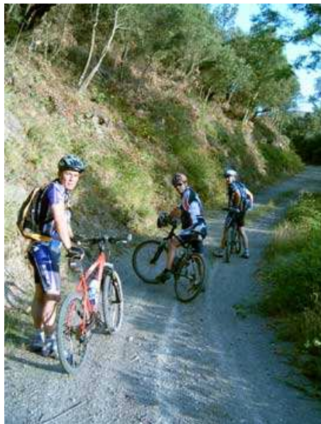
Un respiro en la subida

Recorrido de 50,61 Km y 2.155m de desnivel acumulado. Tien dos tramos no ciclables de 300m y 700 m, debido a la roca y piedra suelta. Para su planificación he utilizado el mapa de la Editorial Alpina, "Montseny. Parc Natural", a E. 1:25.000, realizado con el Datum Europeo 1950.