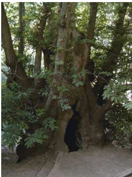
El Castanyer d'en Cuc