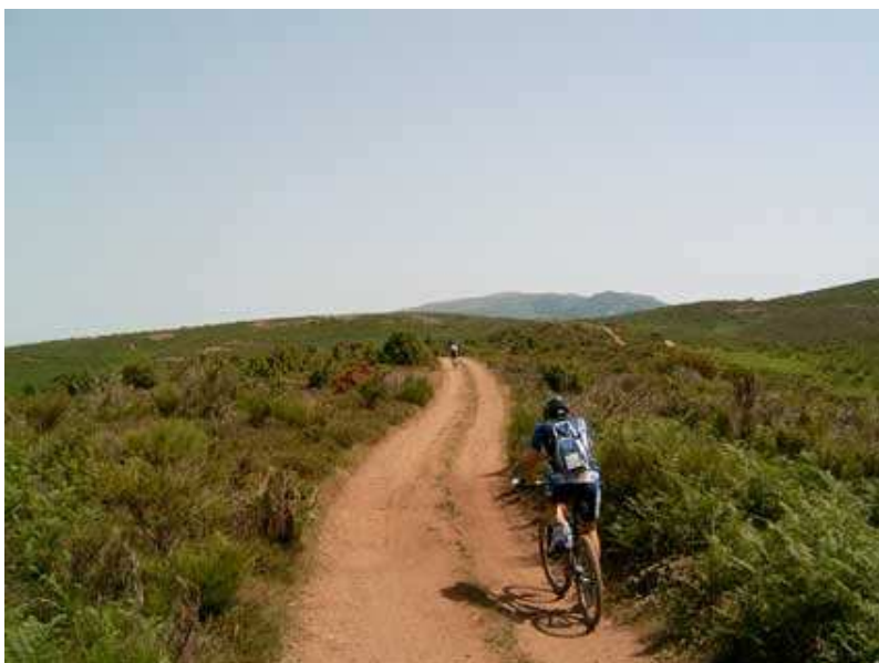
Pla dels Trèmols