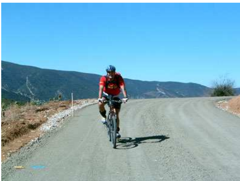
Ángel por la Sierra de Alsamora