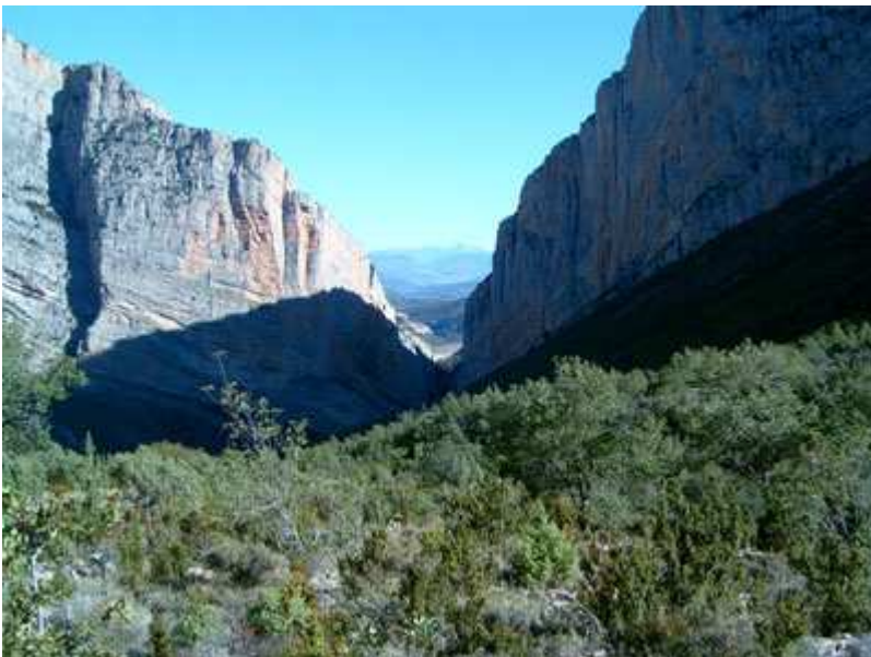
Vista del acceso al Congost de Mont-Rebei