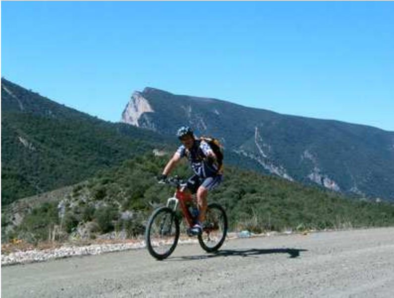
Paco por la sierra de Alsamora