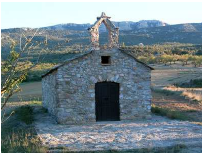
Ermita de Sant Pere Martir