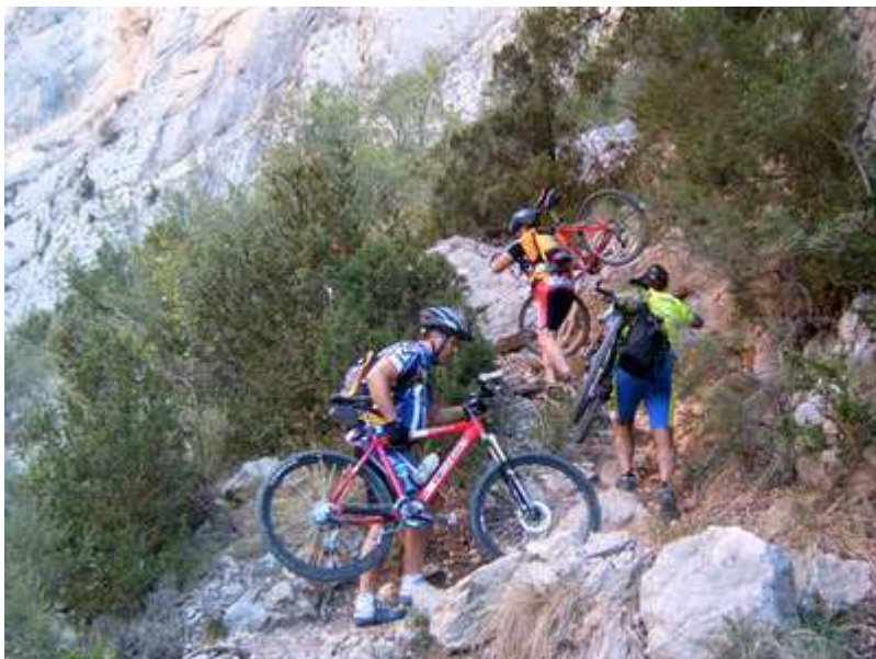
Al Congost de Mont-Rebei