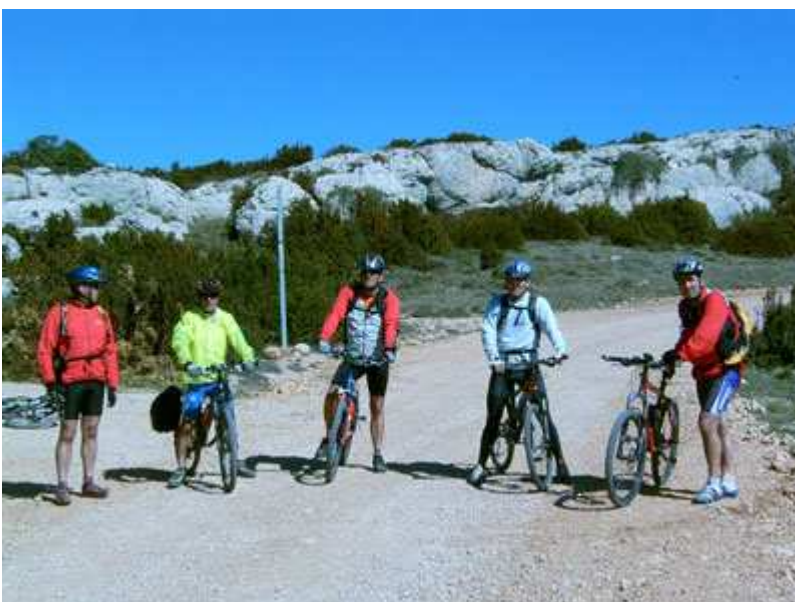
En el Coll d'Àres antes de iniciar el descenso