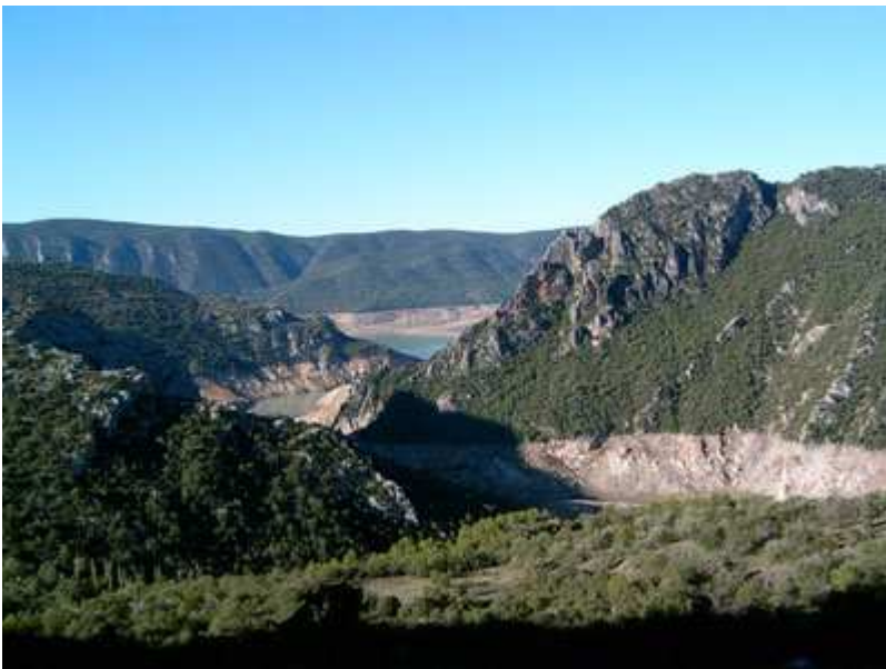
Vista del embalse de Canelles