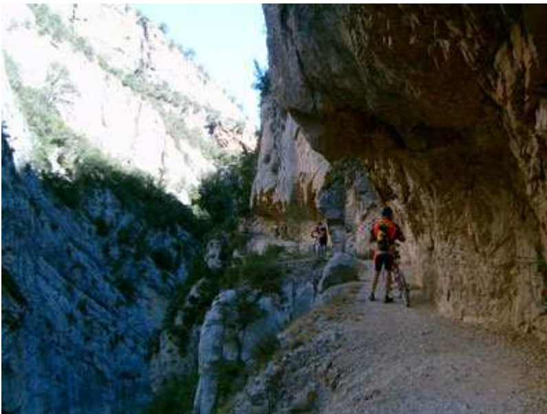
Congost de Mont-Rebei

Seguimos bordeando el pantano hasta llegar a la Masieta, zona de parking donde los excursionistas que hacen a pie el desfiladero llegan en coche por la pista forestal. Desde aquí se inicia una subida por pista ancha y de muy buen firme hasta el pueblo de Alsamora (según la guía del MOPU, tiene 5 habitantes), pista que va a durar poco en seguir siendo una pista, pues daba toda la sensación que la estaban preparando para asfaltar.