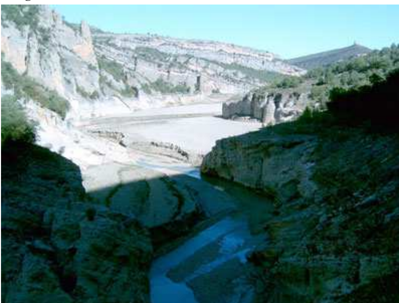
Fin del Congost