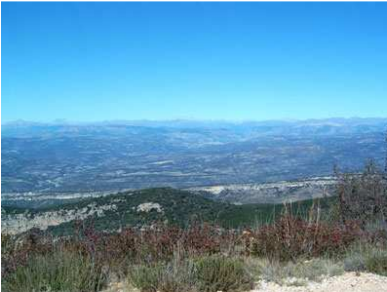
Vistas desde el Coll d'Àres