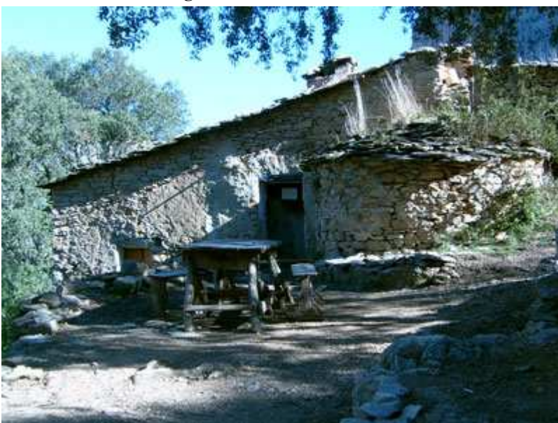
Refugio Mas de Carlets