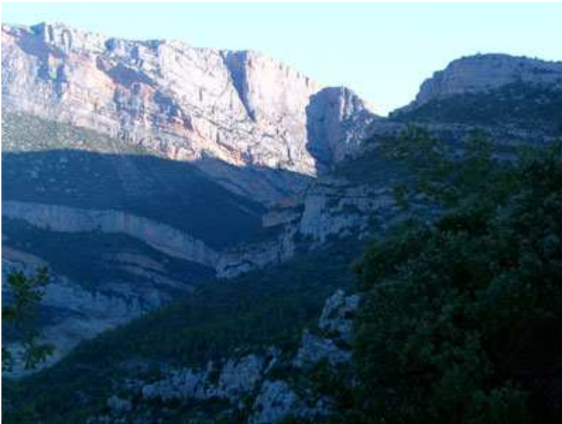
Vista de Montsec d'Estall