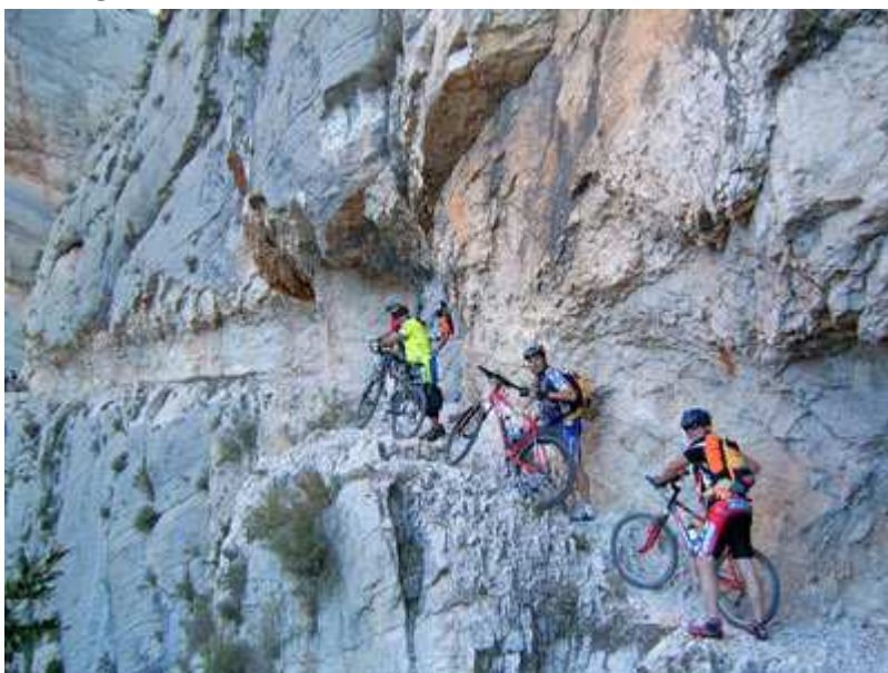
Congost de Mont-Rebei