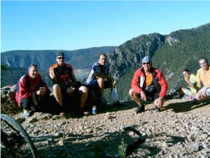
El grupo reponiendo fuerzas