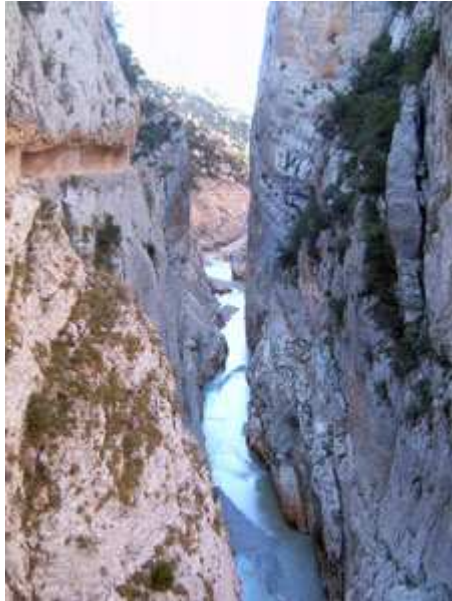
Vista del Congost de Mont-Rebei

El Congost termina prácticamente cuando se cruza un brazo del pantano, este año seco, por un puente metálico colgante.