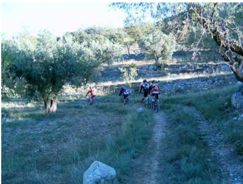
En dirección a Corça