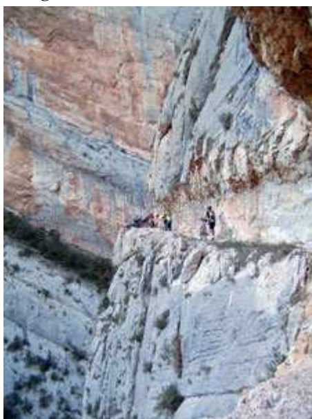
Congost de Mont-Rebei

correctamente la pista. Si al cabo de 100 ó 200 m, se observa que el tracklog se aleja de forma considerable del track, sin perspectiva de que el tracklog vuelva a unirse con el track, quiere decir que existe un error de rumbos paralelos (es decir, dos pistas que parten del mismo punto con rumbo inicialmente paralelos). El error de la representación gráfica sobre el mapa de la pista a recorrer, de la cual hemos obtenido nuestro track, debería inicialmente descartarse pues los mapas topográficos no suelen tener tanto error. Sí que existen errores pero son más pequeños y enseguida se aprecia como el tracklog vuelve hacia el track. En los mapas topográficos puede existir el error exagerado, es decir, de existir o no existir una pista, pero si la pista existe el trazado no varía mucho, salvo modificaciones posteriores a la realización del mapa, otra duda a la hora de interpretar. En el caso de detectar un error de rumbos paralelos se ha de volver al punto de convergencia del track y tracklog, para seguir el track previsto. Este tipo de error me sucedió en un par de ocasiones en este tramo de la ruta, evidentemente acompañado de las correspondientes quejas y bromas del grupo. A tí no te ha de suceder pues sabes que el track es real y en el momento que el tracklog se separe unos 10 ó 20 m del track previsto (siempre navegando en la pantalla Map y a una altitud de aprox. 200 m) tienes que volver al punto de convergencia.