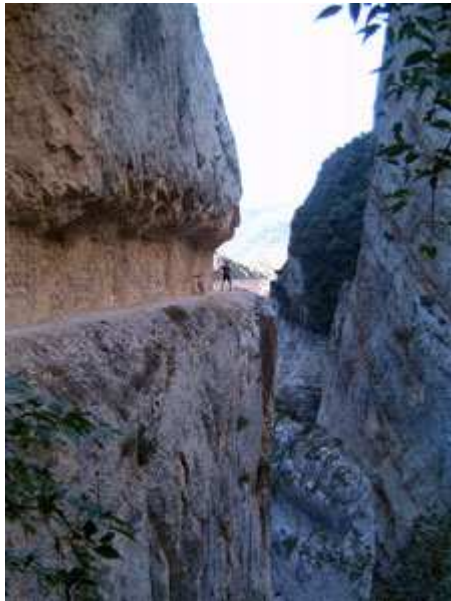
Congost de Mont-Rebei