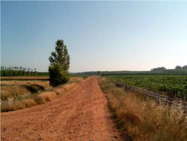
Camino de concentración parcelaria