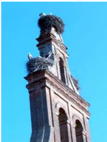
Campanario de la Iglesia de Puente de Órbigo, con 3 nidos de cigüeña.