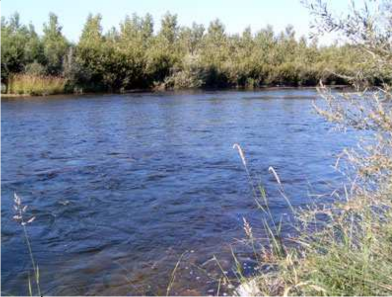
El río Órbigo