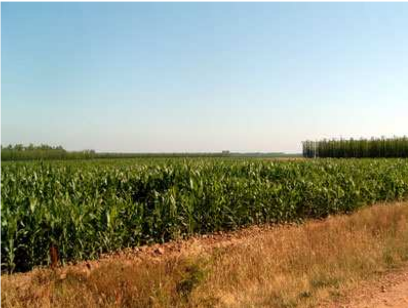
Campos de maíz y lúpulo