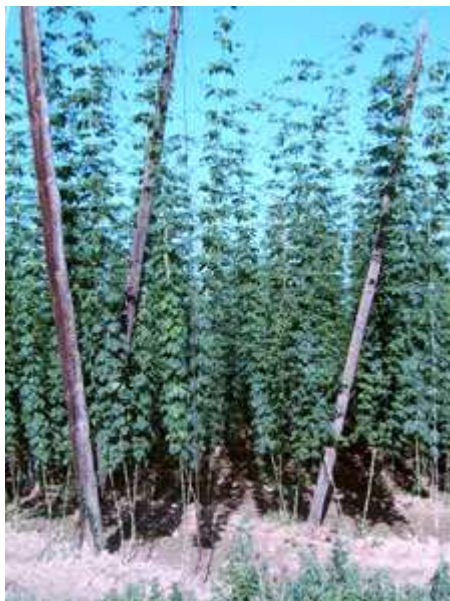
La planta de lúpulo

jugando en el agua, las cuales en cuanto se percibieron de mi presencia, se sumergieron en el agua y no las volví a ver. No me dieron tiempo a poner mi cara de fotos a punto.