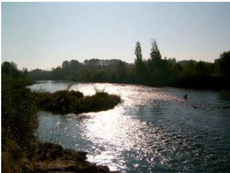
Amanecer en el río