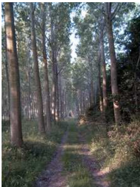
Camino de pescadores