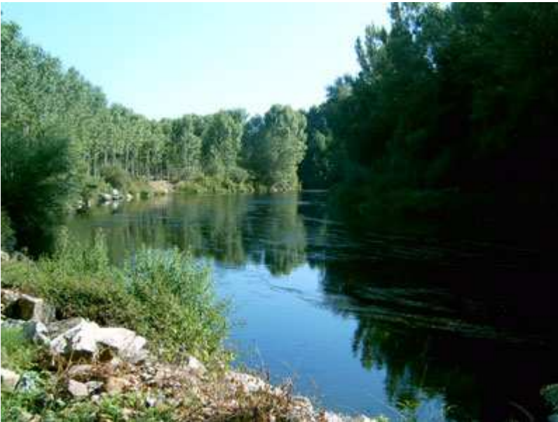
El río Órbigo