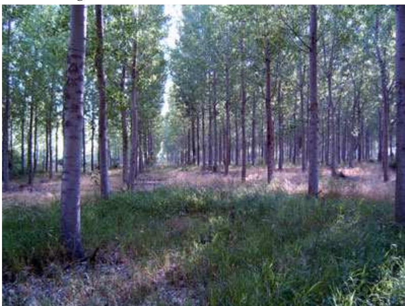
Bosques de chopos