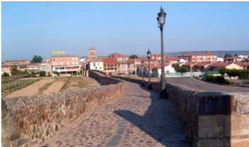
Puente del Paso Honroso (Camino de Santiago)