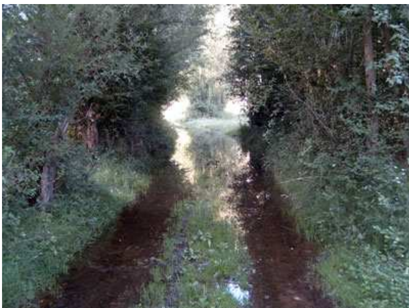
Camino inundado de agua.