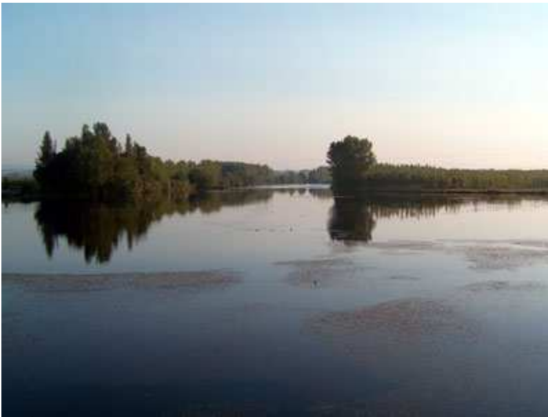
El Órbigo desde el puente de Santa Marina del Rey

Recorrido de 38,229 Km y 247m de desnivel acumulado. Es una ruta en forma de 8, cuyo punto central es el pueblo de Santa Marina del Rey, donde se inicia la ruta. Evidentemente la puedes convertir en una sola ruta circular y por lo tanto iniciarla donde tu quieras. La ruta recorre los dos márgenes del río Órbigo, entre Carrizo y Puente de Órbigo. Principalmente está formada por caminos de concentración parcelaria, por lo tanto caminos bien definidos y fáciles de localizar, aunque también se pasa por caminos de pescadores, especialmente en la zona de Carrizo a Sardonedo, que no son tan fáciles de identificar en alguno de sus tramos (implica mayor atención en el track).