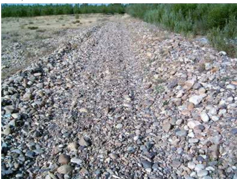
Camino sobre un pedregal de canto rodado.