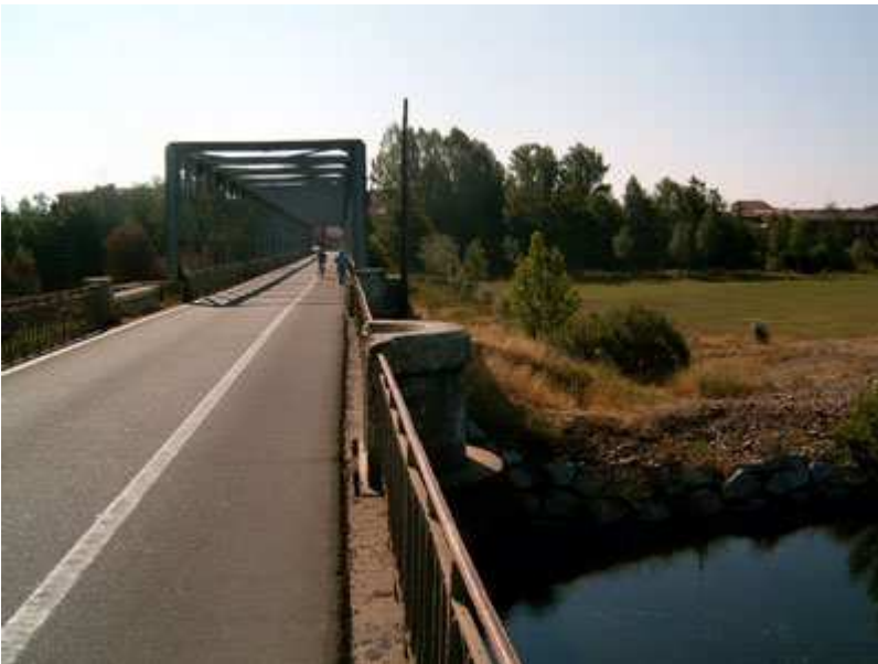
Puente de Carrizo de la Ribera