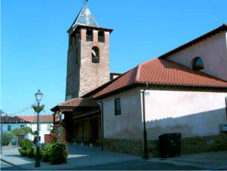
Iglesia de Santa Marina del Rey