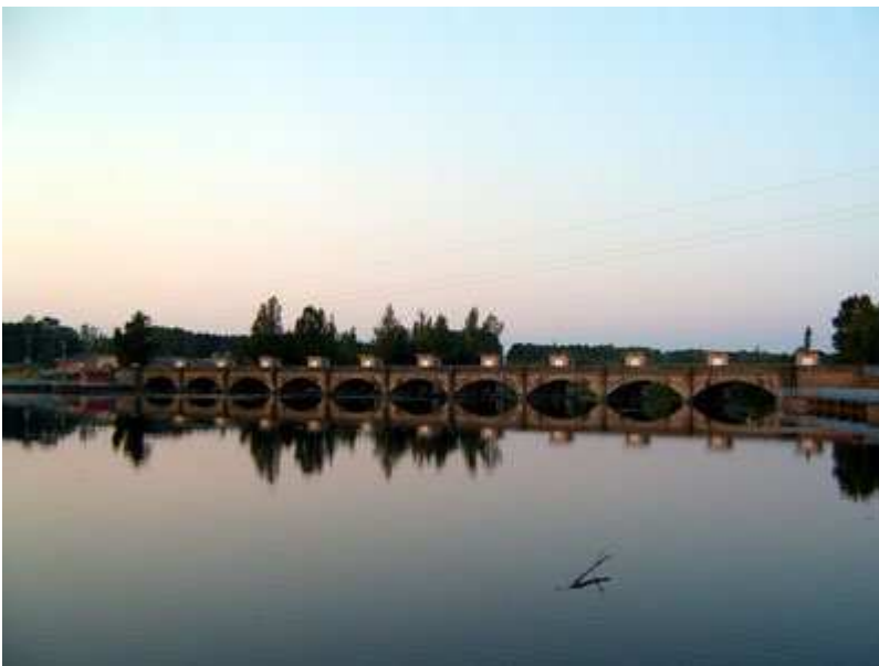
Puente de Santa Marina del Rey

pueblos, como puedes ver en el mapa de localización, pero por los pueblos que realmente entra la ruta son los siguientes: