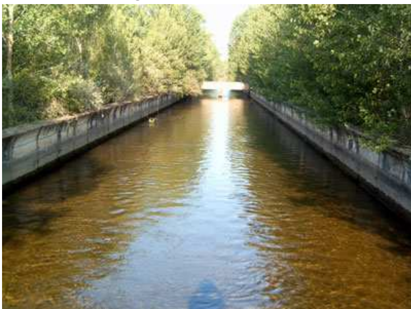
Canal, en la zona de Alcoba