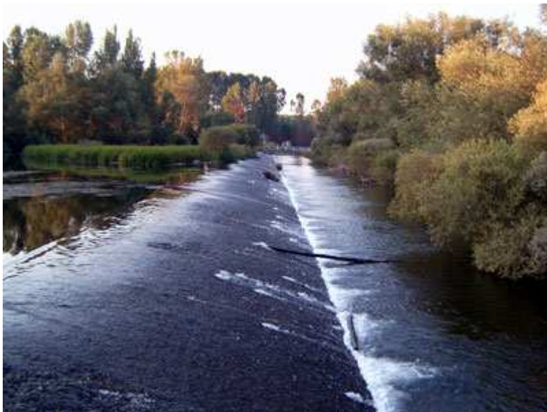
Un salto de agua en la zona de Sardonedo