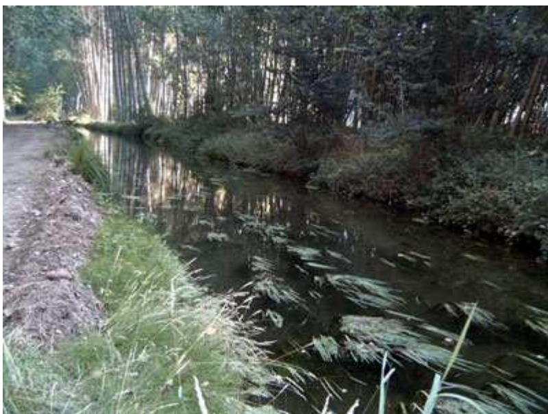
Regueros utilizados para el riego de las fincas.