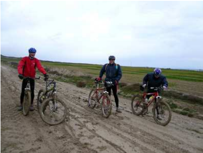
Imposible abanzar con el terreno en estas condiciones