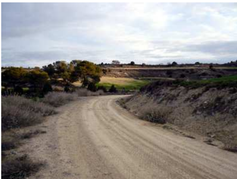
Continuo cambio de caminos y paisajes.