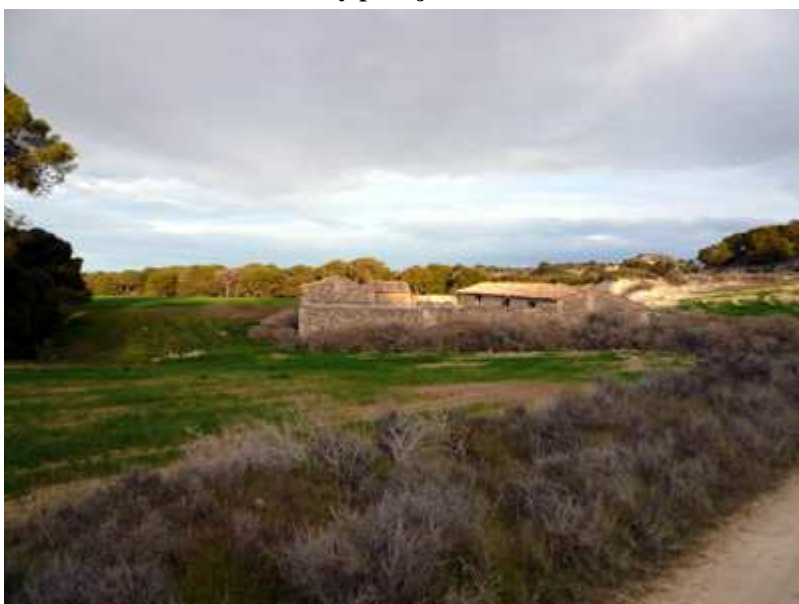
Corral de Lample