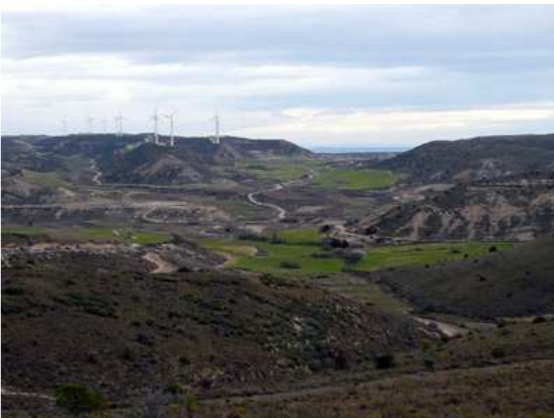
Precios paisaje de la zona