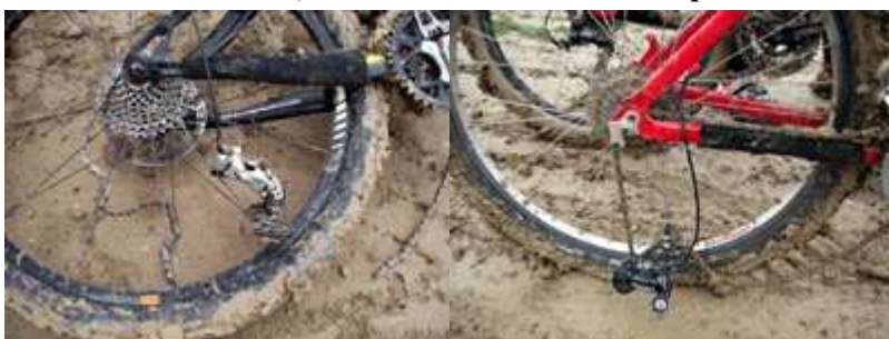
Las dos bicis rotas