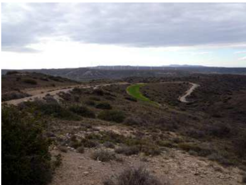
Foto desde Punta Peiré, los molinos están a nuestra espalda