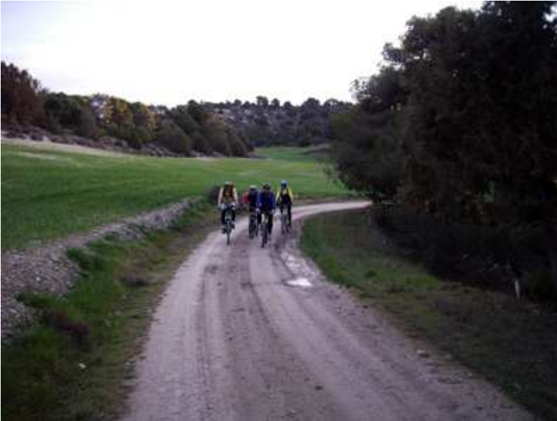
Existen rincones donde la idea desértica de Monegros, desaparece