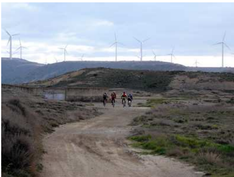
Camino de los molinos