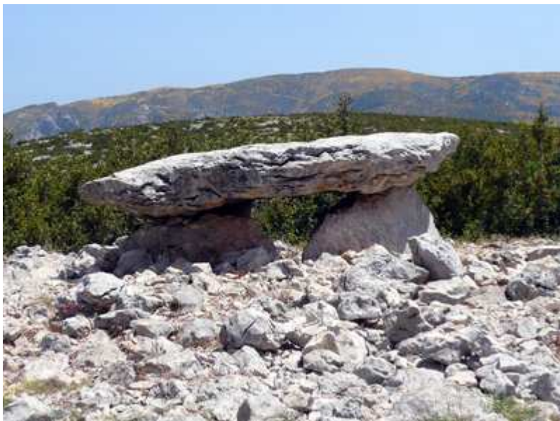
Dolmen de Losa Mora