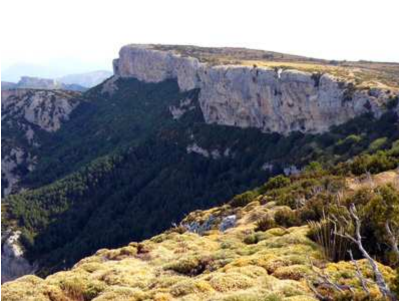
Inicio de la Sierra de Vallés