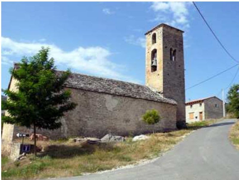
Sarsa de Surta