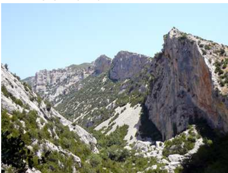
Vista general del cañón de Mascún inferior