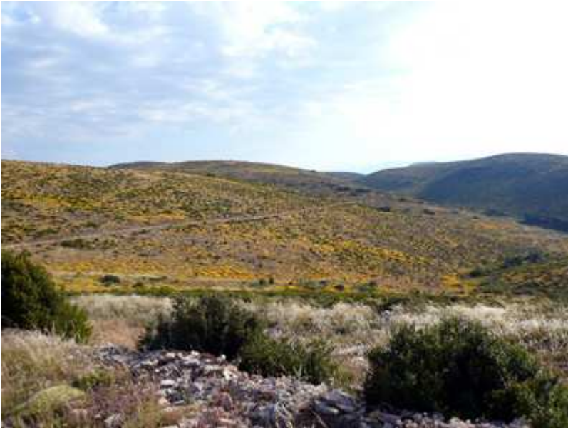
Continuamos por la sierra de Sibil