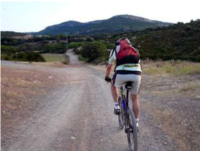
Llegando al pueblo de San Pelegrín