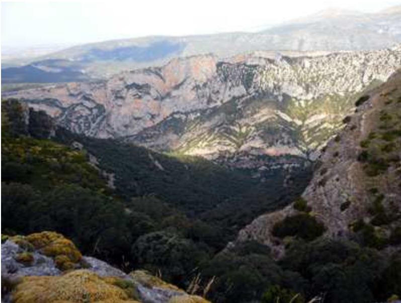
Vistas de la Sierra de Balced