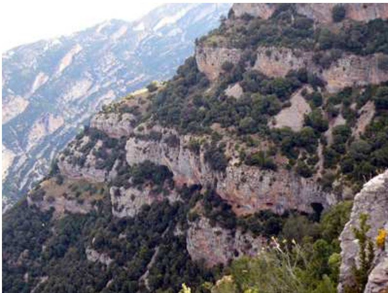
Vistas de la Sierra de Balced