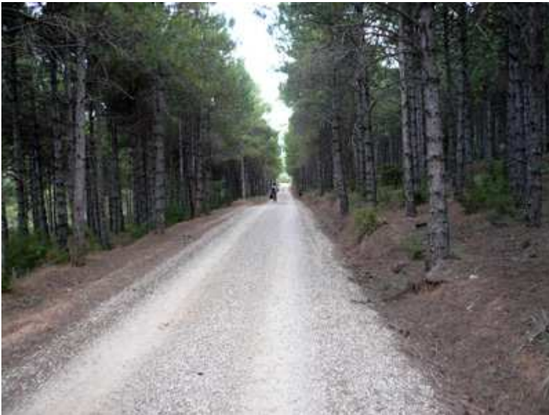
Por la Sierra de Sebil