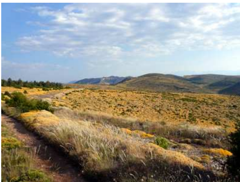
Vistas de la parte alta de la Sierra de Sibil