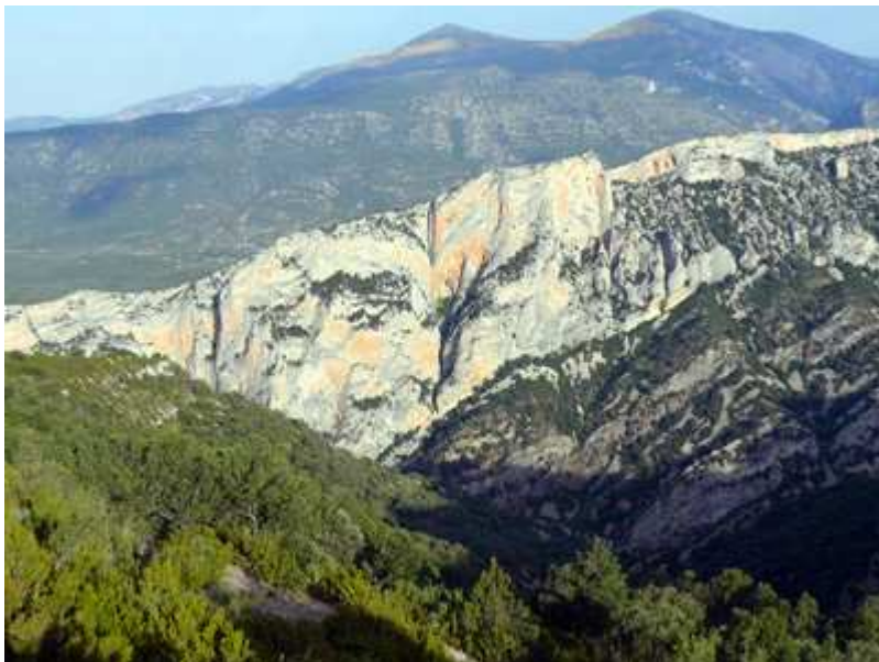
Vistas de la Sierra y Cañón de Balced superior