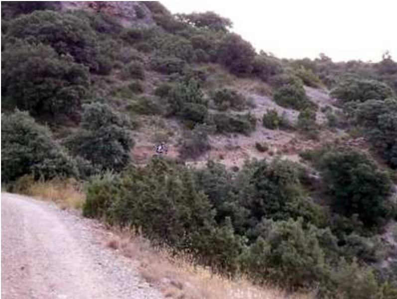
Una vez pasado Radiquero comienza la gran subida

Recorrido de 75,75 km y 2.698 m de desnivel acumulado de subida.