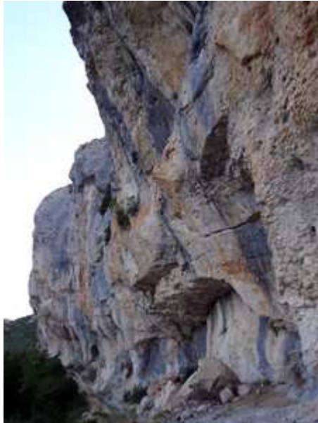
El camino pasa bajo el cortado de roca