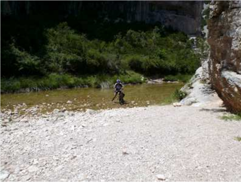
Cruzando el río en el cañón de Mascún Inferior