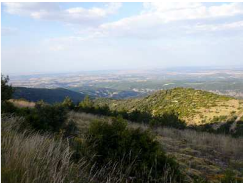
Vista general de la subida realizada