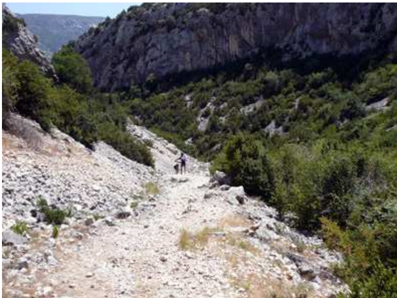
Inicio de la garganta que baja al Cañón