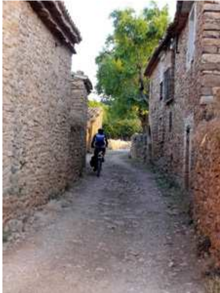
Por San Pelegrín