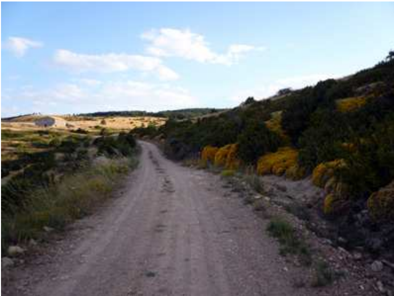
Zona del Tozal de Sebil