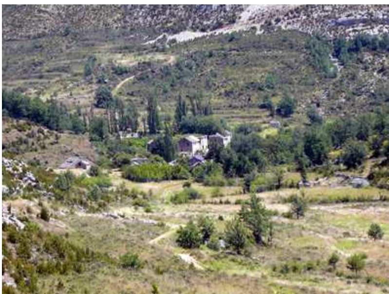
Vista de Otín