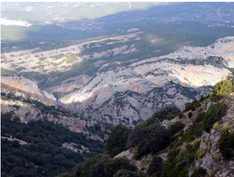
Vistas del cañón Balced Superior