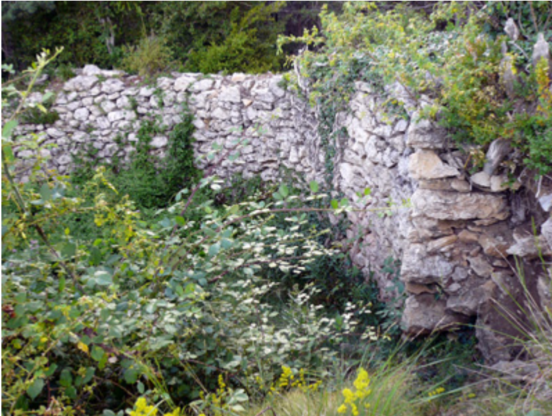
Restos de un pozo de nieve