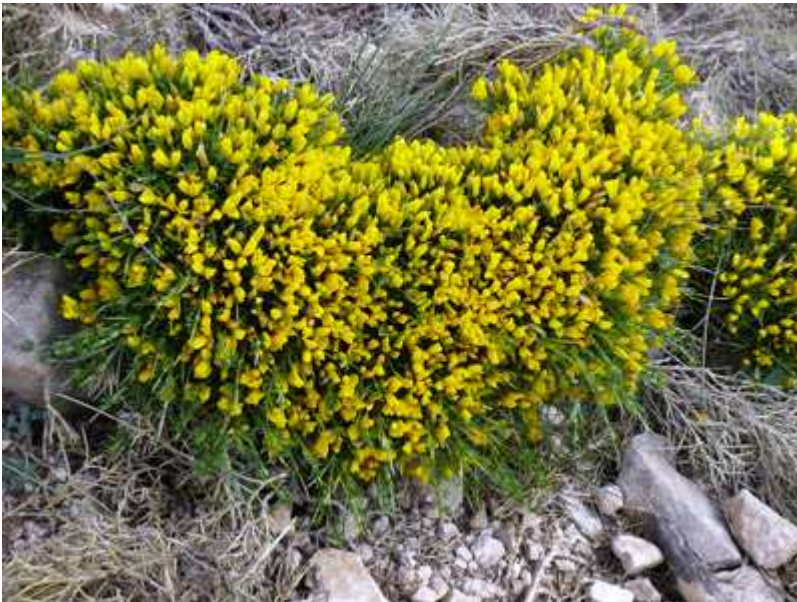
Flores típicas de la zona