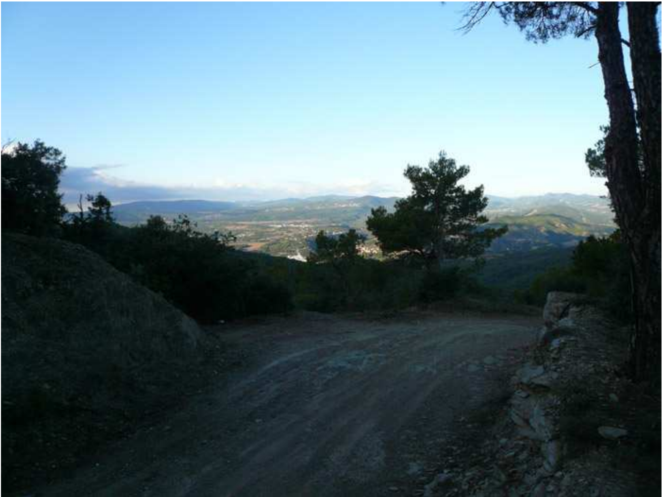
Paisajes que se pueden apreciar durante la subida al Coll.