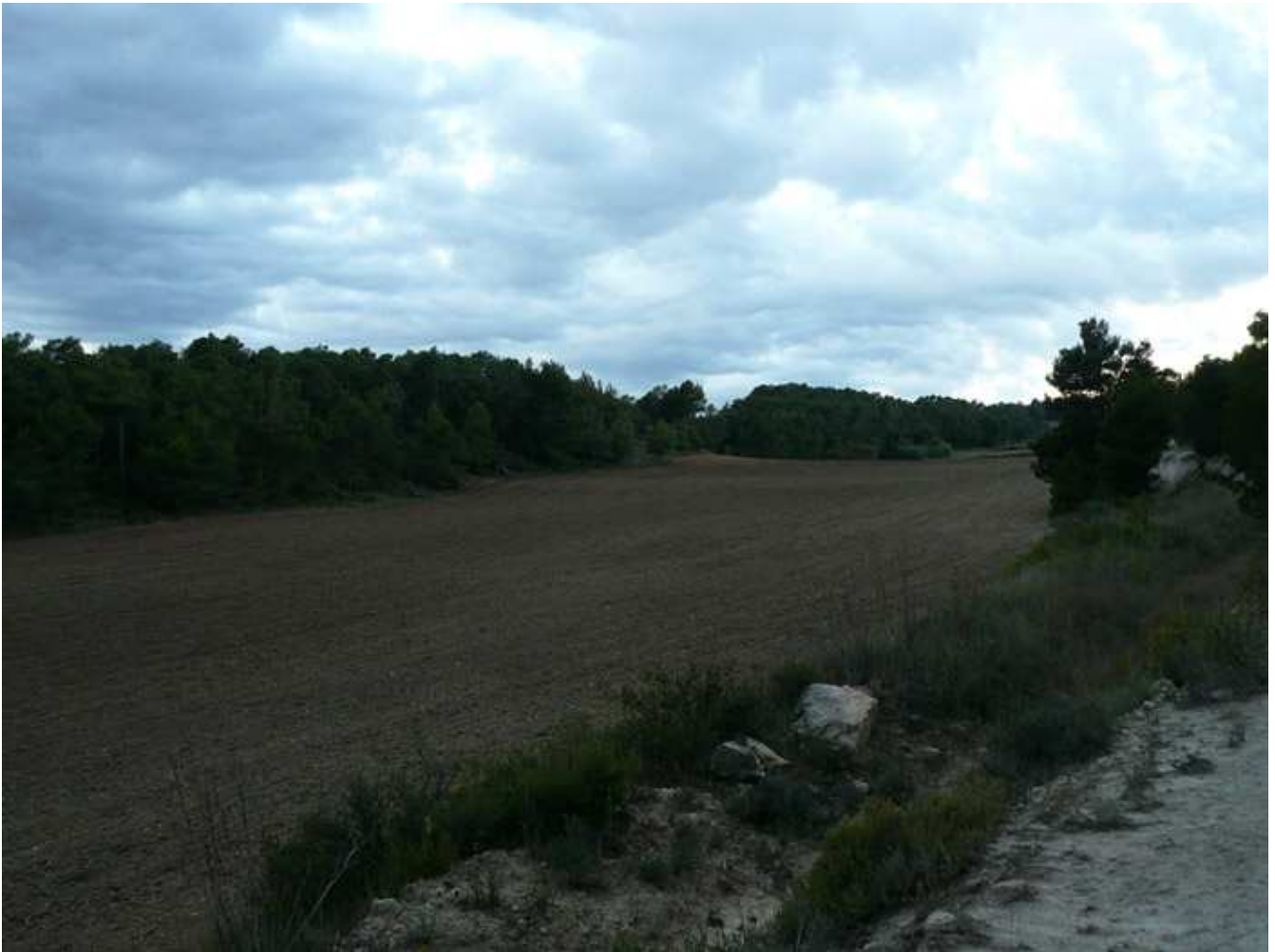
Vistas de los campos de Cal Aromir